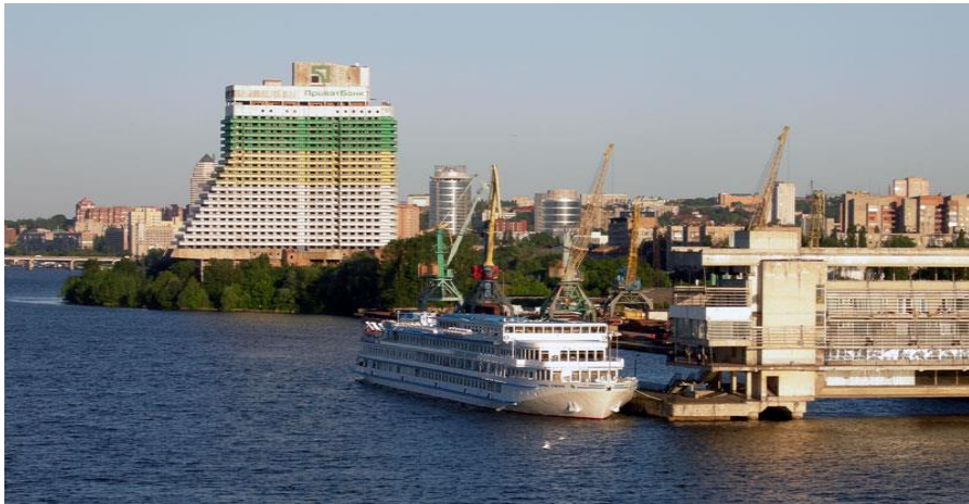
乌克兰河港城市第聂伯