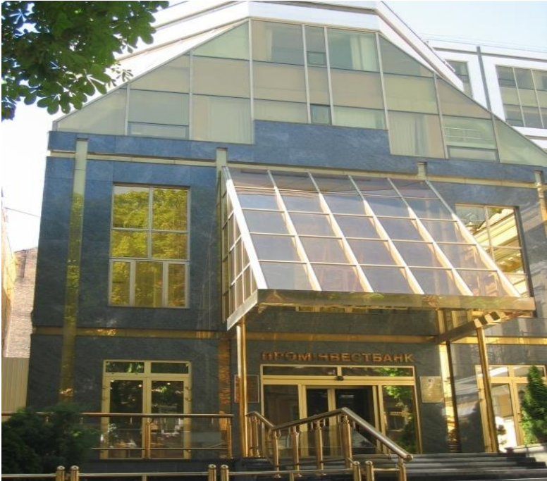
由中资公司承建的乌克兰工业投资银行大楼

【货币互换协议】中乌两国2012年6月签订总额合24亿美元的3年期货币互换协议。2015年4月底, 乌克兰国家银行与中国人民银行达成共识, 将两国货币互换协议延长3年。互换规模为540亿格里夫纳和150亿人民币(约为24亿美元)。新协议执行期3年, 2015年6月23日生效。