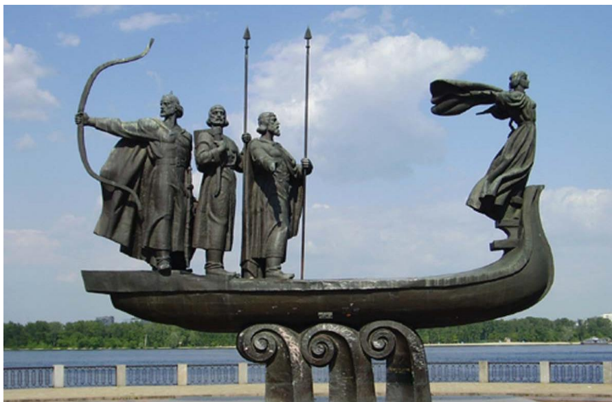
基辅创始人四兄妹雕像

乌克兰全国大部地区为温带大陆性气候。1月平均气温-7.4℃，7月平均气温19.6℃。克里米亚为地中海型亚热带气候。