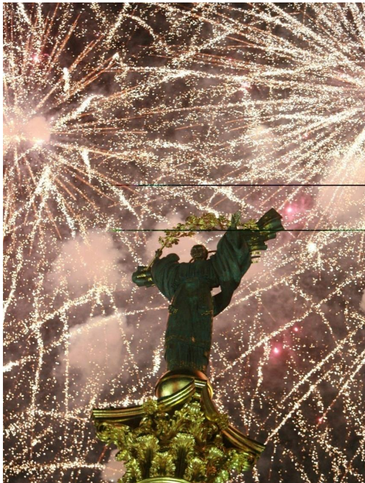
乌克兰基辅独立纪念碑

1990年7月16日，乌克兰议会通过《乌克兰国家主权宣言》。1991年8月24日，乌克兰宣布独立。1991年12月25日，苏联解体，乌克兰成为独立国家。1996年，乌克兰通过新宪法，确定乌为主权、独立、民主的法制国家，实行共和制。