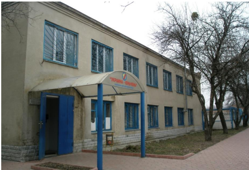
乌克兰运城彩印公司全景

合作协定》、《中乌政府间投资保护协定》、《中乌政府间关于避免双重征税和防止偷漏税的协定》、《中国人民银行和乌克兰国家银行间合作协议》、《中乌政府间海关合作协定》、《中华人民共和国国家统计局和乌克兰统计部合作协议》、《中华人民共和国和乌克兰进出口商品合作评定合作协议》、《中华人民共和国和乌克兰知识产权保护协定》等，上述协定为中乌双方企业开展经济贸易合作奠定了牢固的法律基础。