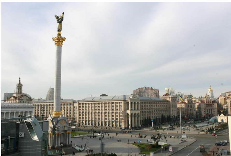
乌克兰基辅独立广场

1917年，东乌克兰地区建立苏维埃政权，成立乌克兰苏维埃社会主义共和国。1922年，苏联成立，乌克兰加入联盟（西部乌克兰于1939年加入）。