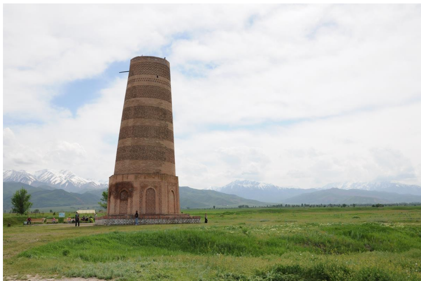
位于碎叶城遗址附近，建于11世纪的布拉纳塔

主要宗教节日有纳乌鲁斯节（穆斯林春节，每年公历3月21日）、开斋节、古尔邦节（也称“宰牲节”），以及东正教的圣诞节和复活节等。工作日每周五天，周六、周日休息。