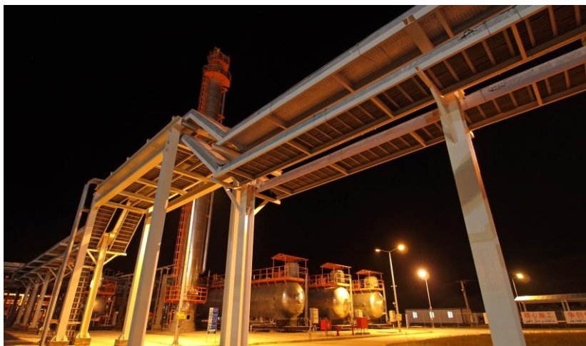
北阿扎德甘油田中心处理站

据伊朗财经部数据，2016年伊核协议生效以来，伊朗已批准吸引外国投资124.8亿美元，其中德国是最大的外资来源国，金额为39.6亿美元。