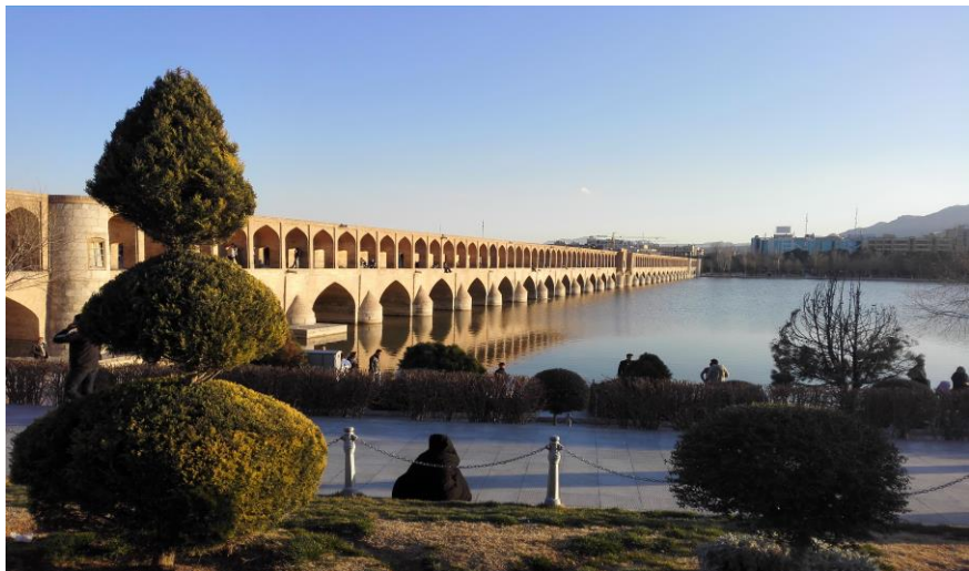
伊斯法罕三十三孔桥