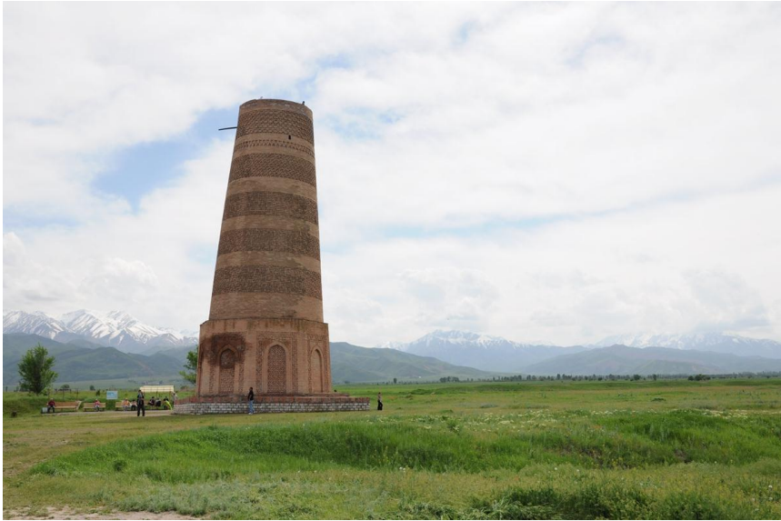
位于碎叶城遗址附近，建于11世纪的布拉纳塔

斋节、古尔邦节（也称“宰牲节”），以及东正教的圣诞节和复活节等。 工作日每周五天，周六、周日休息。