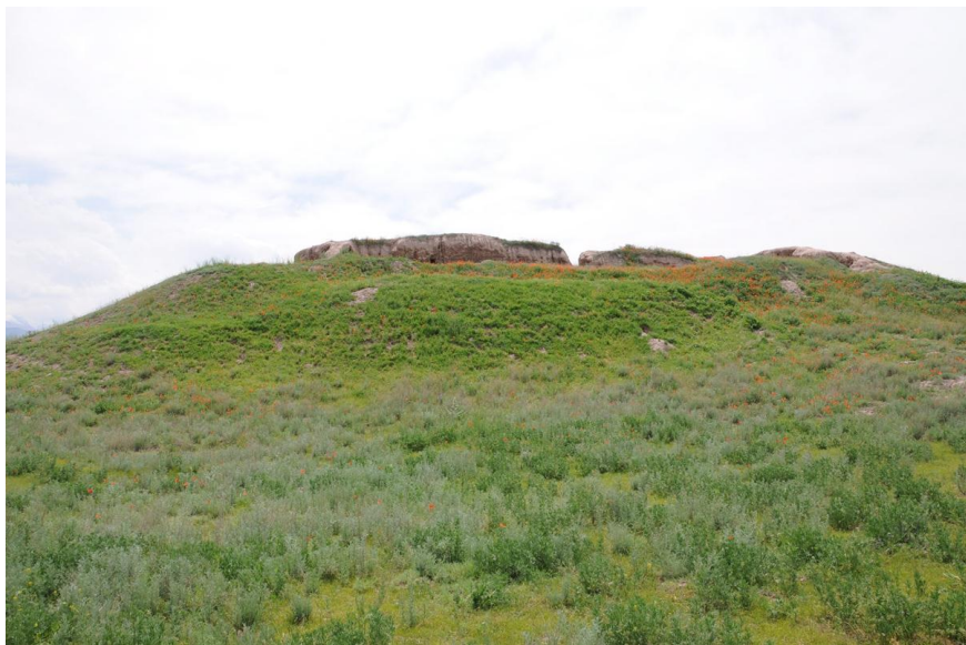
中国诗人李白出生地碎叶城遗址