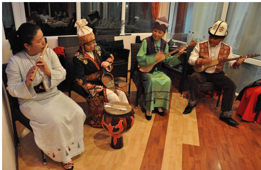
吉尔吉斯族的民族服装和民族乐器

如果一个吉尔吉斯人在饮食方面不遵守以上规矩，那么其行为就会受到社会舆论的谴责，而且有可能永远不被社会尊重。