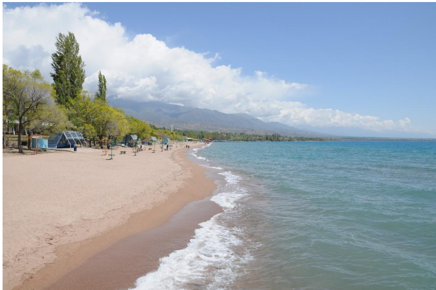
世界第二大高山湖——伊塞克湖