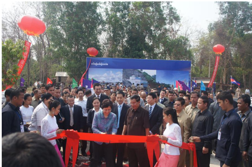
中国驻柬埔寨大使布建国和柬埔寨首相洪森共同为中国企业承包工程剪彩

【承包劳务】据中国商务部统计，2015年中国企业在柬埔寨新签承包工程合同93份，新签合同额14.18亿美元，完成营业额12.14亿美元；当年派出各类劳务人员4546人，年末在柬埔寨劳务人员7884人。新签大型工程承包项目包括中国建筑工程总公司承建柬埔寨金边SINO PLAZA项目；中国重型机械有限公司承建柬埔寨国家电网西南环网输变电工程项目一期；神州长城国际工程有限公司柬埔寨金边豪利国会街商业住宅开发项目等。