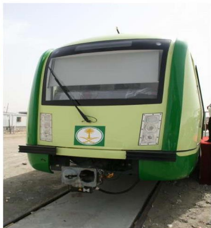
Al Mashaaer Al Mugaddassah Metro Project, under construction by China Railway Construction Corp. Ltd (中国铁建公司)