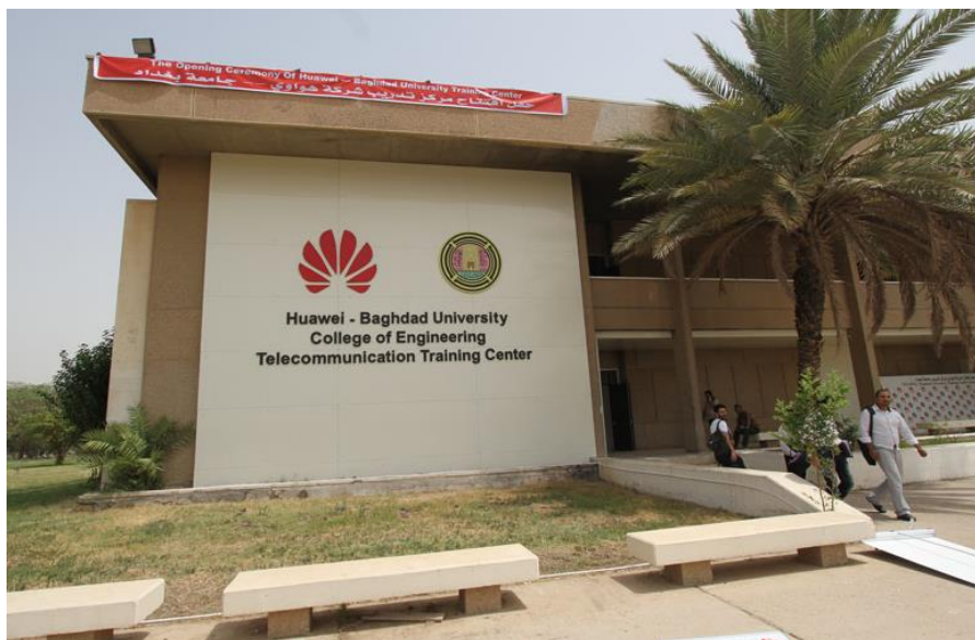
华为-巴格达大学电信培训中心

伊拉克移动用户发展非常迅速，现有的GSM运营商是：ASIA CELL、ZAIN、KORAK及部分地方运营商，用户总数将近3196万。中国华为技术有限公司和中兴通讯有限公司在伊拉克设有分公司，与伊拉克通讯部和运营商有良好合作，均取得了较好回报。