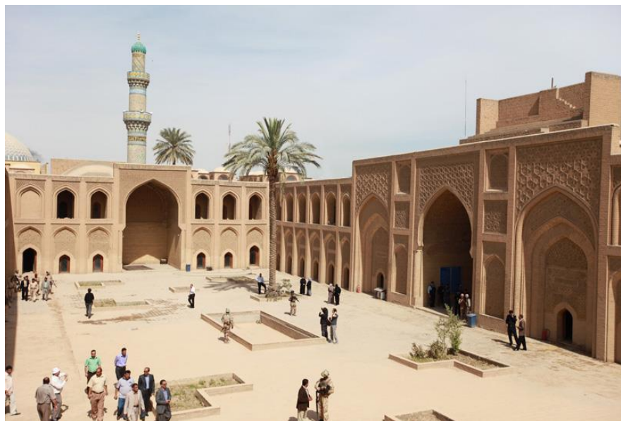
巴格达穆斯坦西里亚大学

【文化】悠久的历史造就了伊拉克灿烂的文化。如今，伊拉克境内古迹遍布，底格里斯河沿岸的塞琉西亚、尼尼微、亚述等均是伊拉克著名的古城。位于巴格达西南90公里的幼发拉底河右岸的巴比伦是与古代中国、印度和埃及齐名的人类文明发祥地，盛传的“空中花园”被列为世界七大奇迹之一。已有1000多年历史的伊拉克首都巴格达更是其辉煌文化的缩影。早在公元8世纪至13世纪，巴格达就成为西亚和阿拉伯世界的政治经济中心和文人学士荟萃之地。