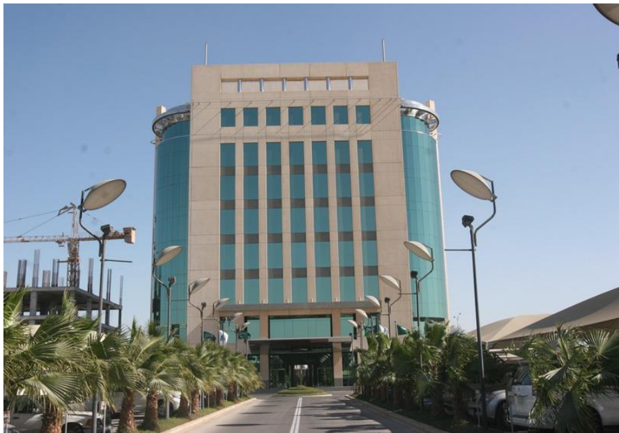
中沙天然气公司（SSG）总部大楼

【能源合作】在油气投资方面，一系列重大能源合作项目取得实质性进展。2004年，中石化集团与沙特阿美公司组建了中沙天然气公司，中标沙特B区块天然气勘探开发项目，双方对该项目的累计投资已经超过5亿美元。沙特阿美公司、福建石化有限公司与埃克森美孚公司在中国福建合资建设了福建炼油一体化项目。中国石化集团和沙特基础工业公司合资兴建的天津炼油化工一体化项目已于2009年建成投产。2014年8月，中石化集团正式决定参股沙特阿美石油公司在沙特延布年产2000万吨的红海炼厂项目。该项目厂址位于沙特西部延布市工业区，毗邻沙特阿美现有炼厂及天然气厂，占地面积487万平方米。项目设计原油加工能力为40万桶/日（约2000万吨/年），以沙特重油作为原料，2016年1月投产。