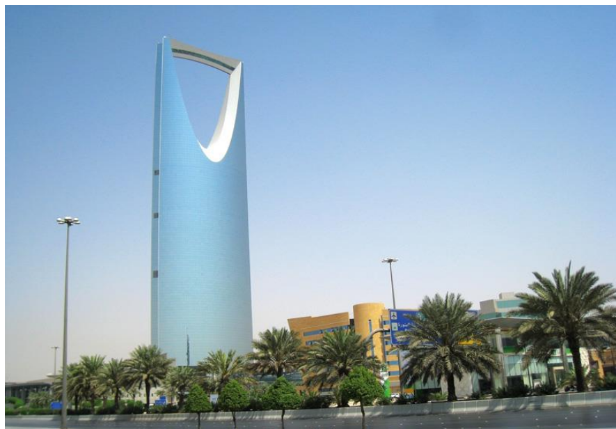
利雅得王国中心大厦

沙特石油剩余可采储量 363亿吨 , 占世界储量的 26% , 居世界首位; 天然气剩余可采储量 8.2万亿立方米 , 占世界储量的 4.1% , 居世界第四位。沙特还有金、铜、铁、锡、铝、锌等矿藏。沙特是世界上最大的淡化海水生产国, 其海水淡化量占世界总量的 20% 左右。