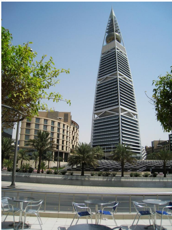
利雅得菲萨利亚塔

首都利雅得（Riyadh）是沙特第一大城市和政治、文化中心及政府机关所在地，位于沙特中部，城区面积1219平方公里，约651万（2016年），其中沙特籍人口约418万。