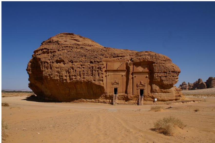
世界文化遗产——美达因萨利赫

在沙特的华人华侨以从事小商业、旅店等服务业为主，少数人在沙特政府部门、商工会、学校、企业等任职。