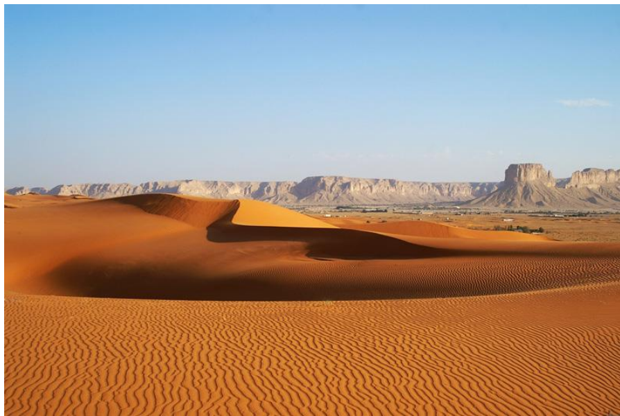
利雅得市郊红沙漠

公元7世纪，伊斯兰教创始人穆罕默德的一些继承者建立阿拉伯帝国，8世纪为鼎盛时期，版图横跨欧、亚、非三大洲。11世纪开始衰落，16世纪为奥斯曼帝国所统治。19世纪英国侵入，当时分汉志和内志两部分。20世纪初，内志酋长阿卜杜勒阿齐兹·沙特经过30年征战，逐步统一了阿拉伯半岛，1924年，阿卜杜勒阿齐兹·沙特兼并汉志，次年自封为国王，1932年9月23日，宣告建立沙特阿拉伯王国，这一天被定为沙特国庆日。