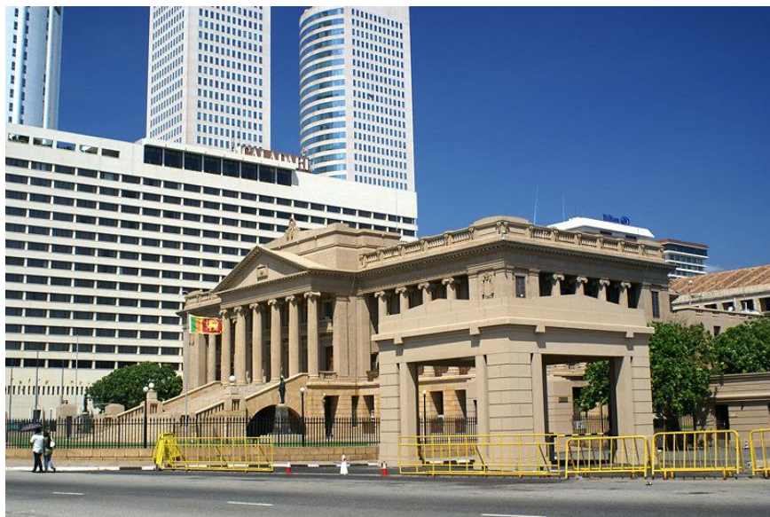
总统秘书处办公楼

【总统】总统为国家元首、政府首脑和武装部队总司令，享有任命总理和内阁成员的权力。现任总统为自由党人迈特里帕拉·西里塞纳，于2015年1月9日宣誓就职，任期5年。