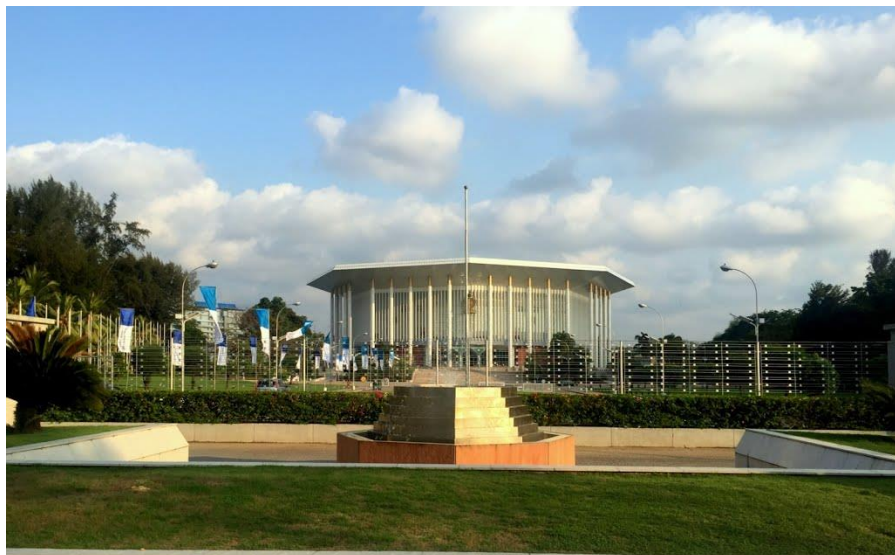
中国政府援建的纪念班达拉奈克国际会议大厦

31.6°C，最低气温24.2°C。山区平均最高气温26.6°C，最低气温18.2°C。从全岛来看，每年3-6月气温最高，11-1月气温较低。各地年平均降水量1283-3321毫米不等。