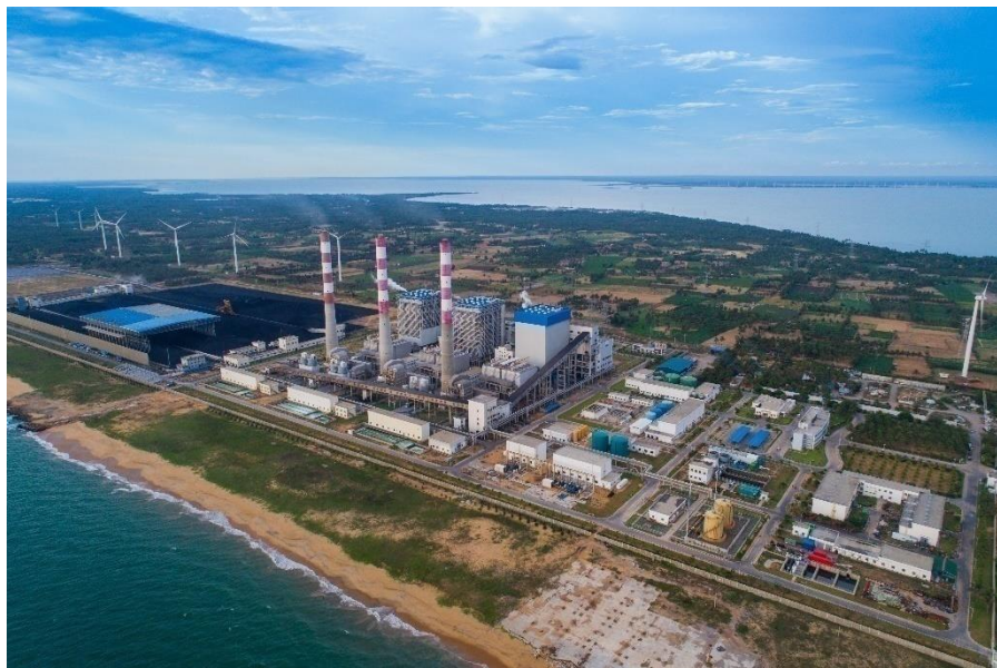
普特拉姆燃煤电站

此外，斯里兰卡电网老化非常严重，亟待升级改造。电网经常出现由于电网线路故障而导致燃煤电站进入保护性停机，从而迫使斯里兰卡电力局采取部分区域限电措施。