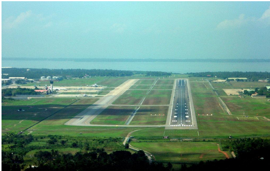
班达拉奈克国际机场

目前，中国国际航空公司执行成都至科伦坡直达航班，中国东方航空公司执行上海、昆明至科伦坡直达航班，旅客可以搭乘中国民航班机，通过成都、上海和昆明口岸转机到达科伦坡；同时，斯里兰卡航空公司执行北京、上海、广州和昆明至科伦坡直达航班；旅客也可通过香港、曼谷、新加坡、马来西亚等地转机来科伦坡。