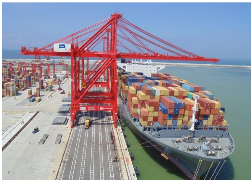
科伦坡港南集装箱码头

中国政府提供贷款、中国港湾工程有限责任公司建设的汉班托塔港基建工程已经完成，部分业务已投入运营。