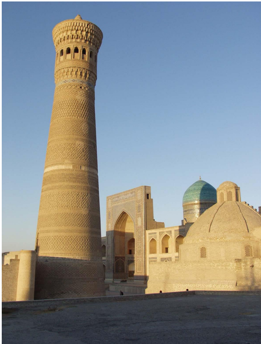
历史名城——布哈拉古迹