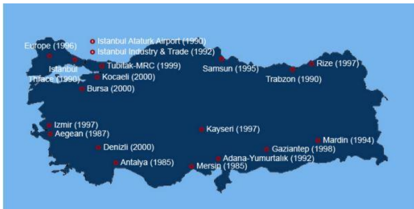
图3-2：自由经济区地理位置和设立时间

土耳其自由经济区内允许从事各种活动，包括生产、存储、包装、一般贸易、银行业务。投资者可不受任何约束地创建他们自己的设施，经济区还为投资者提供办公场地、生产车间或仓库，政策对投资者非常有利。各领域的活动都向土耳其和外国公司开放。