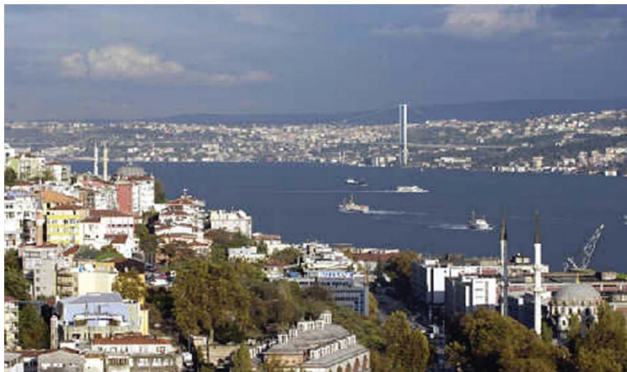
土耳其著名港口——伊斯坦布尔海港

土耳其北、西、南三面环海，即黑海、马尔马拉海、爱琴海和地中海，还有达达尼尔海峡和博斯普鲁斯海峡，海岸线长达7200公里，这使其海上运输颇具竞争优势。