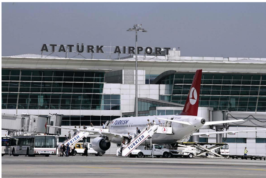
土耳其著名机场——伊斯坦布尔阿塔图克国际机场

据土耳其航空管理总局统计，2015年搭乘土耳其各家航空公司的国内旅客数量同比增长14.1%，达到9700万人次；国际旅客数量同比增长4.4%，为8400万人次。国内航班的数量增长10.8%，为83.57万班次；国际航班数量增长4.9%，为62.08万班次。