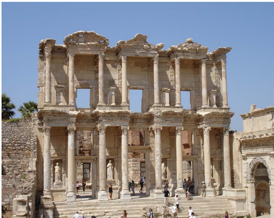
土耳其名胜古迹——埃菲斯

土耳其绝大部分居民信仰伊斯兰教，其中85%属逊尼派，其余为什叶派；其余的人信仰东正教、天主教、犹太教等。土耳其宗教气氛相对宽松，与其他西亚地区伊斯兰国家迥异，在男女握手、饮酒等方面无特殊禁忌，但禁食猪肉。进入清真寺作礼拜时须洁净身体、脱鞋，男性须着长衣、长裤或长袍，女性须系头巾、着长袍，男女分开礼拜，忌大声喧哗。