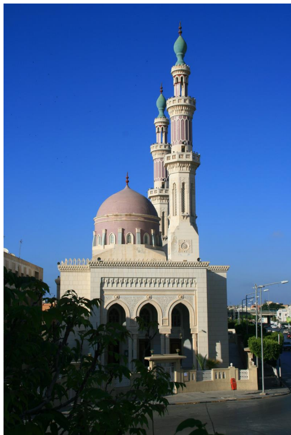
利比亚穆罕默德清真寺

伊斯兰教是国教。逊尼派穆斯林信众占96.6%，基督教占2.7%，佛教占0.3%。