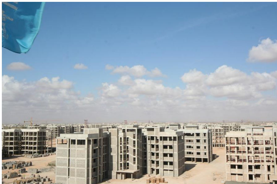
中建利比亚班加西富德15000套住宅工程施工现场

2016年中国企业在利比亚新签承包工程合同5份，新签合同额3643万美元，完成营业额3205万美元；当年派出各类劳务人员142人，年末在利比亚劳务人员249人。新签大型工程承包项目包括中兴通讯股份有限公司承建LIBNA运维四期项目等。