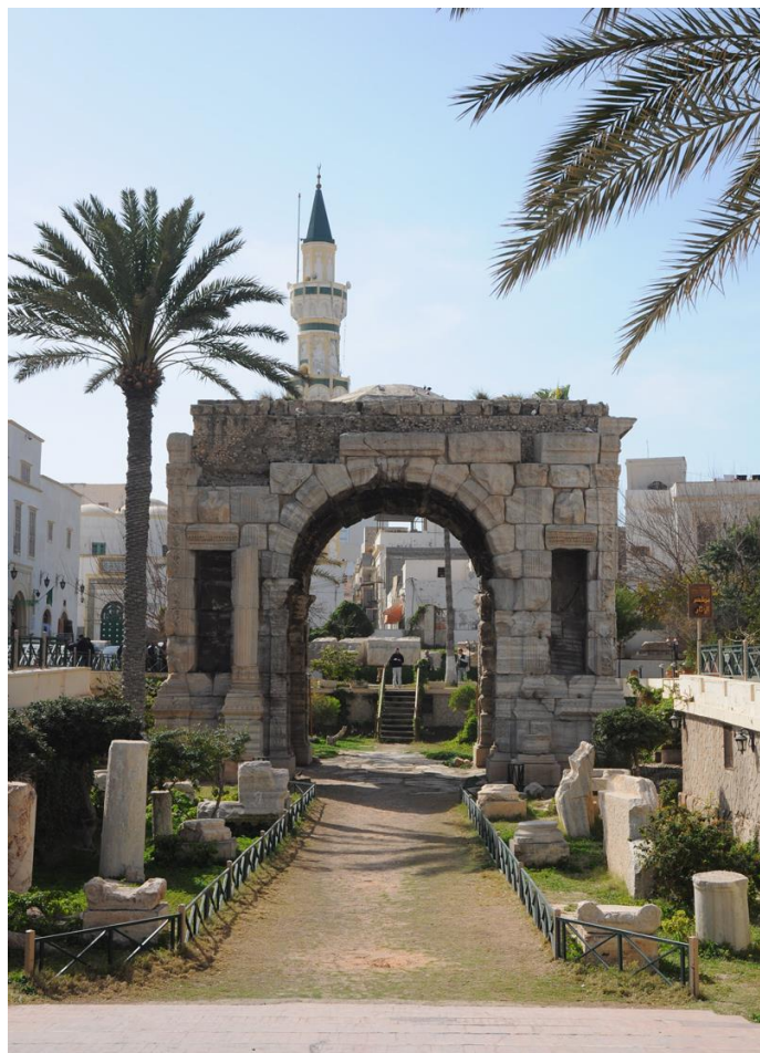
的黎波里市中心古城清真寺

工，抗议临时政府和国民议会对不断恶化的安全局势缺乏有效行动。众多学校停课，店铺停业，通往机场的道路也被关闭，许多旅客滞留在机场，飞往班加西的部分航班也被迫返航。此次抗议活动持续一周多时间。