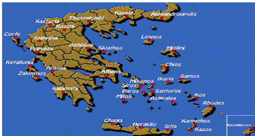
希腊主要机场分布图