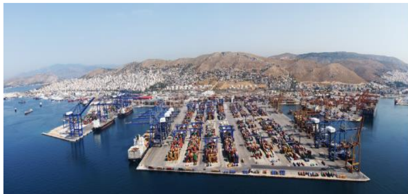
中远海运比雷埃夫斯集装箱码头公司