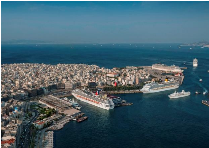
中远海运比雷埃夫斯港口公司

【承包劳务】据中国商务部统计，2016年中国企业在希腊新签承包工程合同13份，新签合同额7618万美元，完成营业额2.99亿美元；当年派出各类劳务人员137人，年末在希腊劳务人员167人。新签大型工程承包项目包括华为技术有限公司承建希腊电信等。