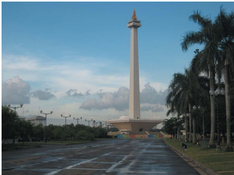
印尼独立纪念碑广场

【 人民协商会议 】为印尼国家最高权力机关，由人民代表会议（即国会）和地方代表理事会共同组成。主要职能包括：制定、修改和颁布宪法；根据大选结果任命总统、副总统；依法对总统、副总统进行弹劾等。每5年选举一次。本届人民协商会议于2014年10月通过全民直选产生，成员692名，包括560名国会议员和132名地方代表理事会议员。设主席1名，副主席4名。现任主席为祖尔科菲力·哈桑。