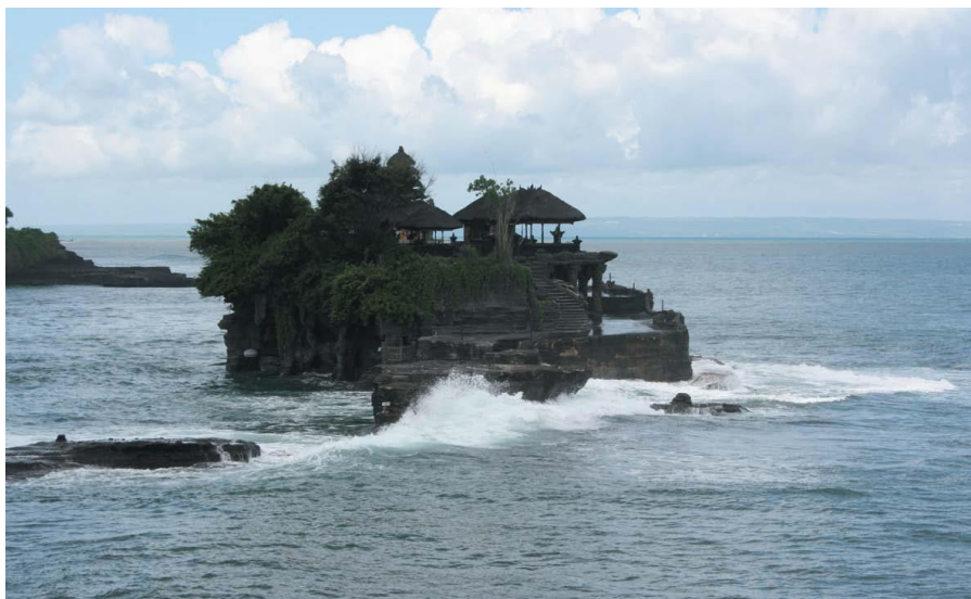
巴厘岛著名景点——海神庙

【同马来西亚的关系】马来西亚联邦与印尼于1957年建交，1963年9月马来西亚成立后两国断交，1967年两国复交。2008年1月、2010年5月和2012年12月，印尼总统苏希洛访马。2015年2月佐科总统对马来西亚进行访问。