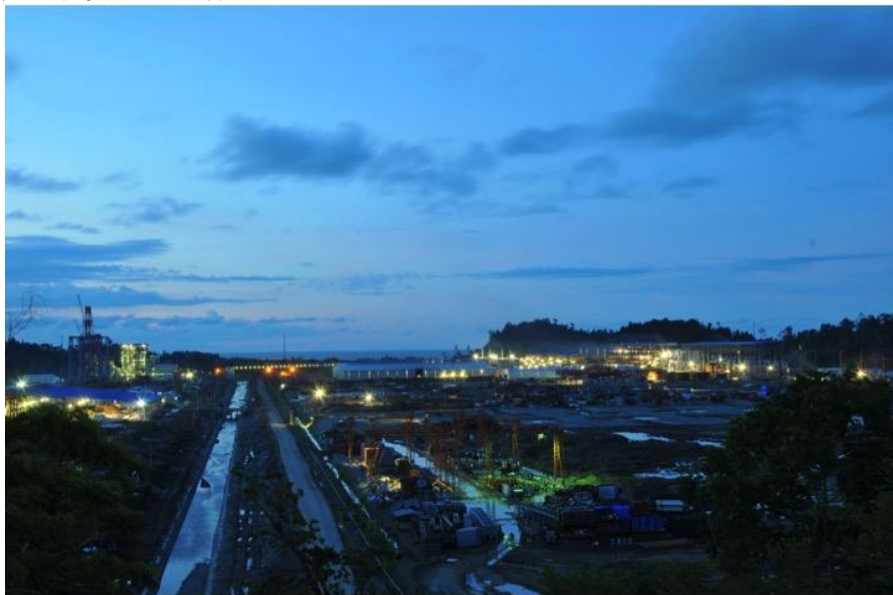
中国企业在印尼投资的青山工业园

【投资】据中国商务部统计，2016年当年中国对印度尼西亚直接投资流量14.61亿美元。截至2016年末，中国对印度尼西亚直接投资存量95.46亿美元。到印尼寻求投资合作的中国企业不断增多，涉及领域日益广泛，大型投资项目不断涌现。