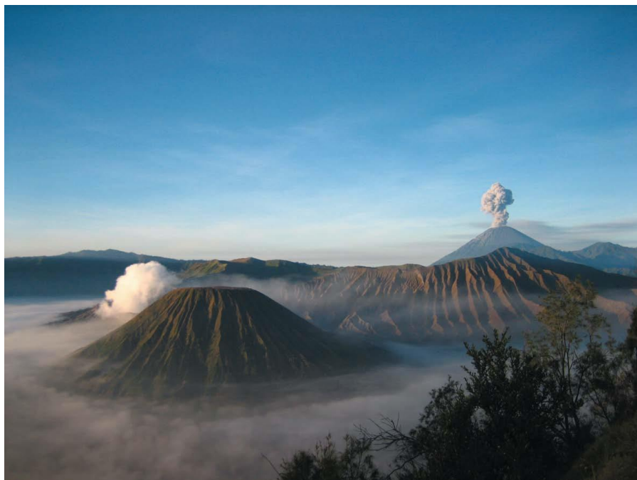
印尼著名的活火山—BROMO火山