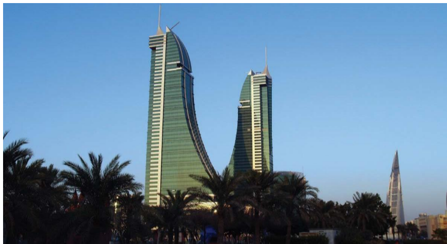
巴林金融港和世界贸易中心