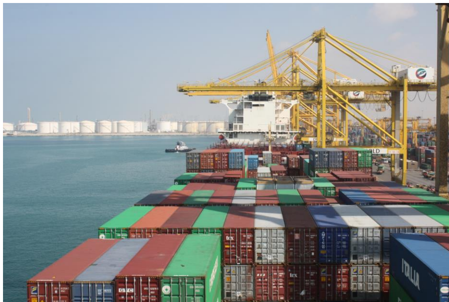
杰布阿里集装箱码头

目前，阿布扎比酋长国哈里发港一期已完工。项目第一阶段包括具有年处理200万20英尺标准箱能力的港口和面积51平方公里的工业区A区。哈里发港已取代扎耶德港成为阿布扎比的主要货运港。目前，哈里发港口吞吐量为250万标箱和1200万吨一般货物。