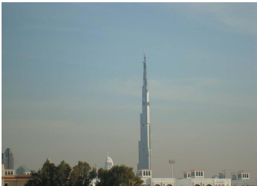
世界第一高楼——哈利法塔

原穆巴达拉发展公司建立于2002年10月，是由阿布扎比酋长国全资所有的投资和开发公司。穆巴达拉发展公司是阿联酋政府的主要投资部门之一，主要投资领域涉及石油、天然气、航空科技、能源工业、教育、基础设施及服务、房产开发、制造业等。穆巴达拉全资子公司马斯达尔（MASDAR）成立于2006年4月，致力于发展新能源和清洁技术，并建有马斯达尔城（MASDAR City）。马斯达尔城被规划为世界第一个碳中性、零污染、全部依靠再生能源的城区，国际可再生能源机构（IRENA）总部将设在该城。