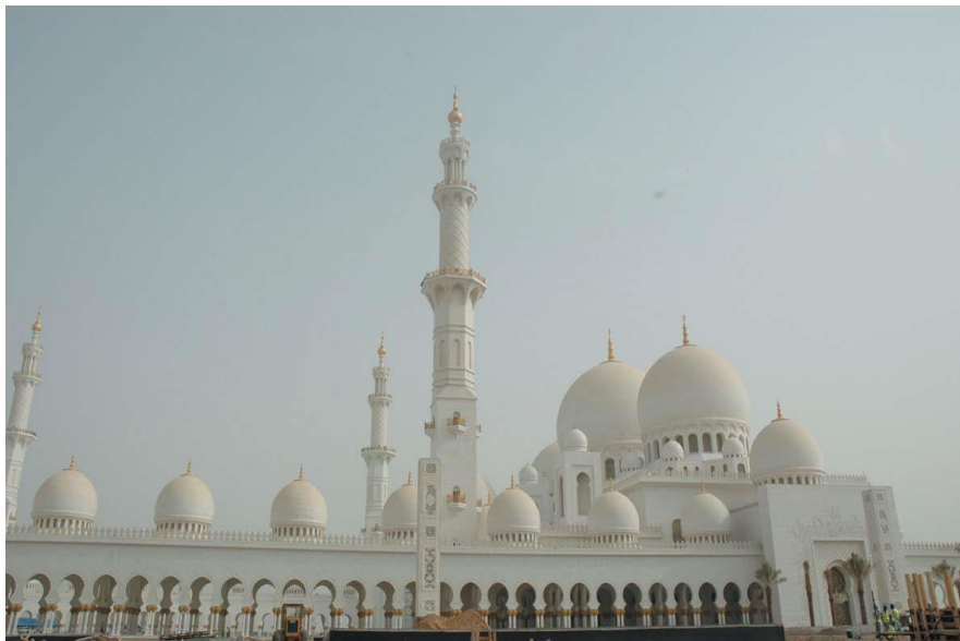
阿联酋最大清真寺—扎耶德清真寺

伊斯兰教是国教。居民大多信奉伊斯兰教，其中多数（80%）属逊尼派，什叶派在迪拜占多数。