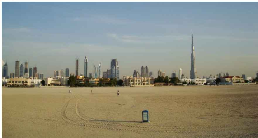
迪拜中央商务区远眺

世界经济论坛《2016-2017年全球竞争力报告》显示，阿联酋在全球最具竞争力的138个国家和地区中，排第16位。