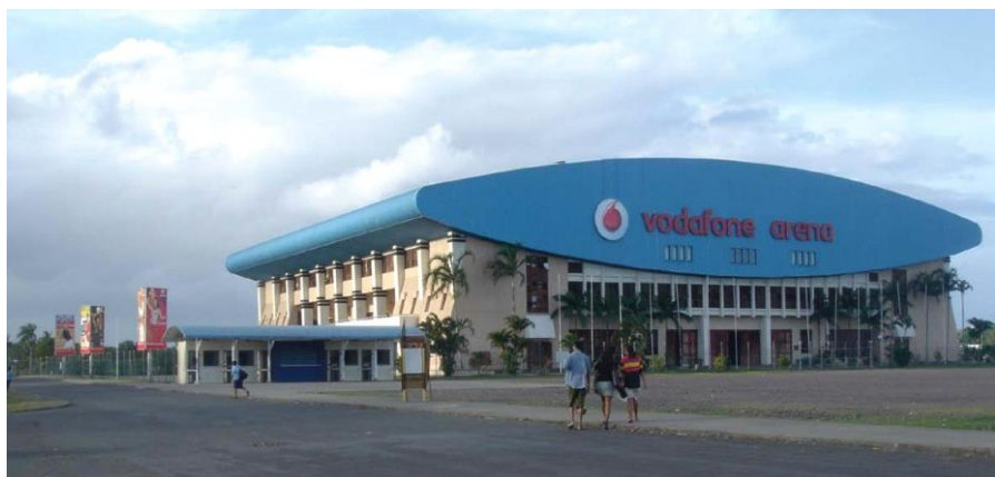
中国援建的多功能体育馆