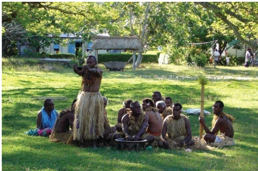
斐济敬献卡瓦仪式

【医疗】据世界卫生组织统计，2014年斐济全国医疗卫生总支出占GDP的4.5%，按照购买力平价计算，人均医疗健康支出364美元；2015年斐济人均寿命为70岁。平均每万人拥有医生6人、护理和助产人员22人、牙医2人、药师1人。男性平均寿命为67岁，女性为73岁。因饮食结构问题，约70%的斐济人口体重超重，35.9%的人口属于肥胖症，心血管疾病、糖尿病等非传染性疾病是斐济主要致命疾病。2017/18财年，斐济医疗卫生预算为3.2亿斐元，占政府总预算支出的7.4%。2014年7月31日，中国政府援建的斐济纳务瓦医院正式启用，对提高当地医疗水平发挥巨大作用。目前中国政府在斐无援外医疗队。近年来，斐济未出现严重传染病，登革热是主要流行病，2018年1-5月，斐济全国共登记登革热病例3197例，约是2017年同期的3倍。2018年斐济爆发脑膜炎球菌病，斐政府免费为青少年提供疫苗，及时控制了疫情。