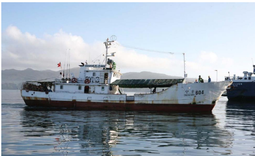
在斐济水域作业的中水公司渔业船舶

斐济投资局数据显示，2017年，中国投资者在斐济注册投资项目共193个，意向投资额2.37亿斐元，计划创造就业岗位1625个；当年实际实施项目87个，金额2590万斐元，创造就业岗位253个。