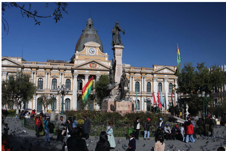
穆里略广场—总统府和议会所在地

全国人口1130万（2018年6月），其中，圣克鲁斯省人口最多，为315万人；其次是拉巴斯省，286万人；科恰班巴省人口为194万人，排在第三位。在玻利维亚华人数量约为5000人左右，主要集中在圣克鲁斯省。