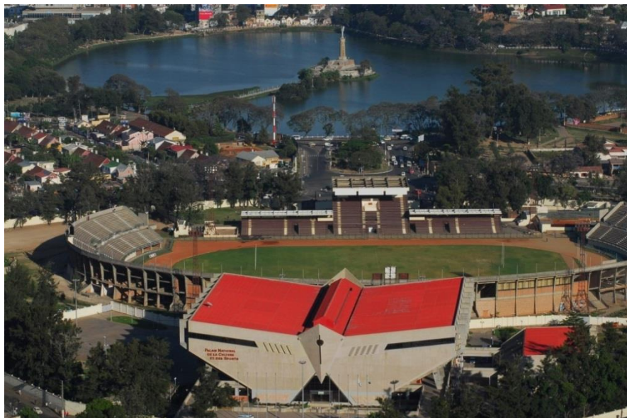
中国援建的马达加斯加体育文化馆