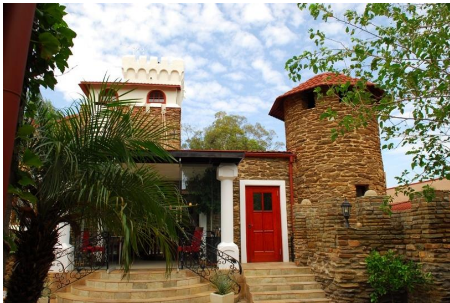
温得和克的城堡餐厅