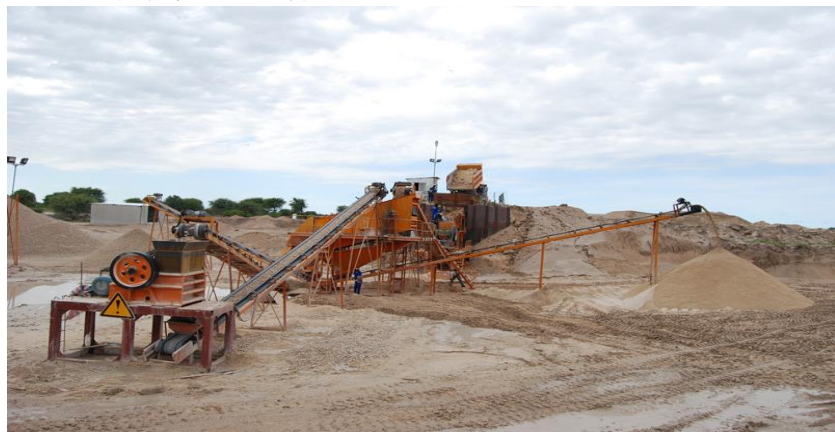
由上海宝钢和中冶成工联合总承包的OHORONGO水泥厂建设项目

地原则、海关程序和海关文件简化进行商榷；第二阶段将涉及贸易相关问题，如贸易服务、竞争政策、知识产权和贸易发展竞争力等。三方贸易谈判论坛（TTNF）自2011年12月召开以来，迄今已举办了三次，目前论坛已完成筹备工作，将就区域工业化方案和三方贸易和运输便利化方案等相关实质问题进行讨论。方案通过后的实施，将大大减少跨境贸易成本，创造更多就业岗位，推动经济增长。