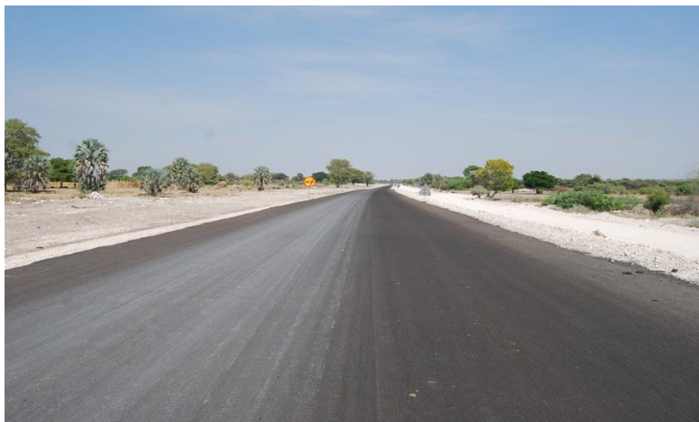
河南国际公司承建的北部公路项目现场

根据纳米比亚公路局，2017年纳米比亚公路总长度约为44534公里，其中B级沥青路7076公里、沙石路25710公里，土路11460公里，盐泥路288公里，多数路况良好。年平均客运输量5万人次，货运量18万吨。