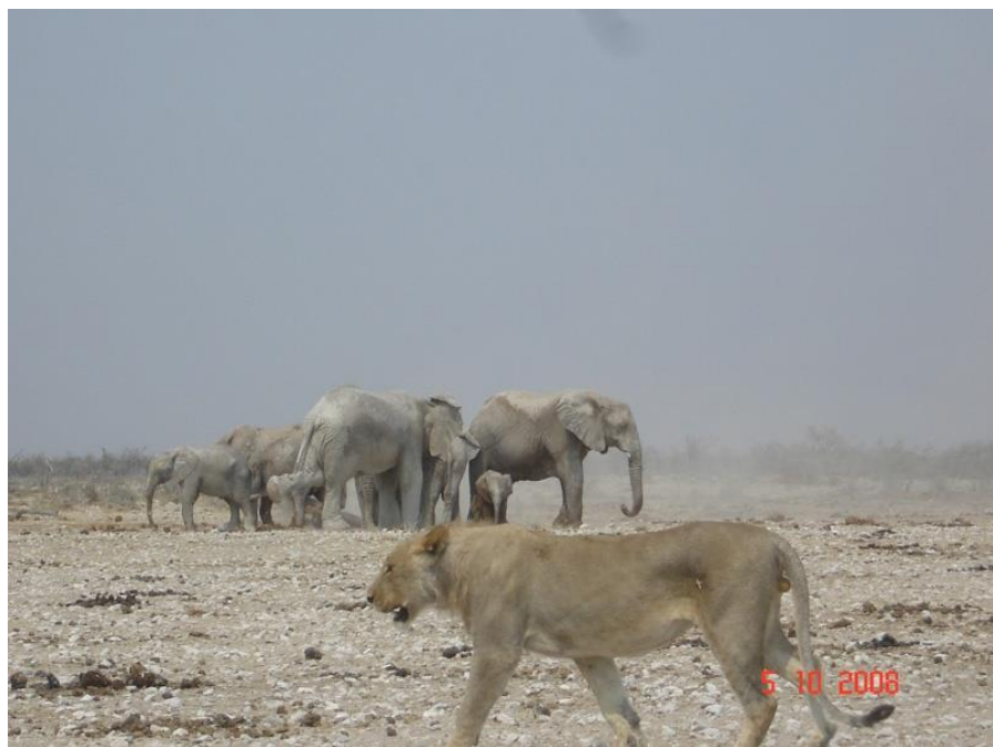
埃托沙野生动物园

纳米比亚位于东2时区，当地时间比格林尼治标准时间早2个小时，比北京时间晚6个小时。纳米比亚没有夏令时。