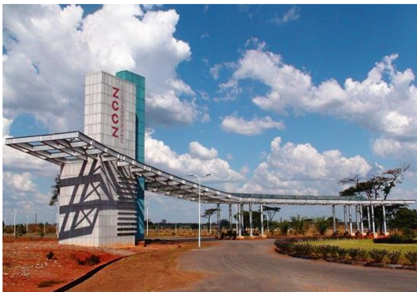
中赞经贸合作区谦比希园区

【承包工程】据中国商务部统计,2017年中国企业在赞比亚新签承包工程合同175份,新签合同额48.65亿美元,完成营业额23.07亿美元;累计派出各类劳务人员4563人,年末在赞比亚劳务人员8780人。新签大型工程承包项目包括中国江西国际经济技术合作公司承建赞比亚恩都拉地区收费公路;金诚信矿业管理股份有限公司承建孔科拉铜矿基建与采矿项目;中国成套工程有限公司承建赞比亚卡夫拉夫塔供水项目等。