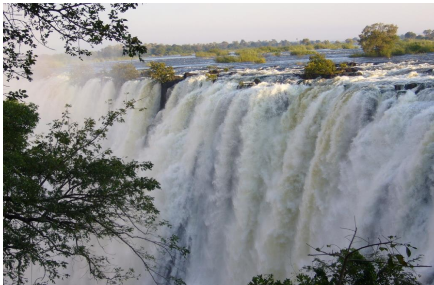
利文斯顿维多利亚瀑布

【建筑业】得益于国家对基础设施建设的重视，赞比亚建筑业对GDP的贡献率逐年上升，2016年GDP增长的3.4个百分点中，建筑业贡献了0.9个百分点，位列第一。近年来，道路、机场、水电站以及超市等房建项目陆续开工，拉动了赞比亚建筑业的迅速发展。