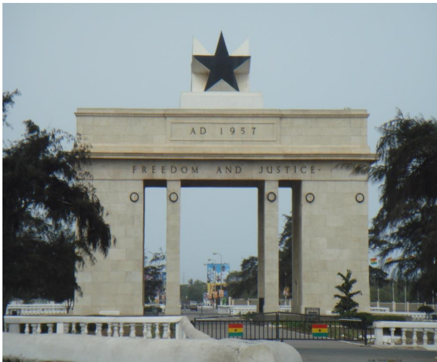
加纳首都标志性建筑——独立广场

【总统】总统执掌行政权，为国家元首和海陆空三军总司令，由4年一度的普选产生，限两个任期，有权任命副总统。大选中如总统候选人均未获得50%以上选票，在21天内由两名得票最多的候选人参加第二轮投票选举。由总统任命以及地区和机构代表组成的25人国务委员会为总统咨询机构。2016年12月9日，加纳举行新一轮大选，新爱国党（NPP）总统候选人纳纳·阿库福-阿多获胜，2017年1月7日宣誓就职。