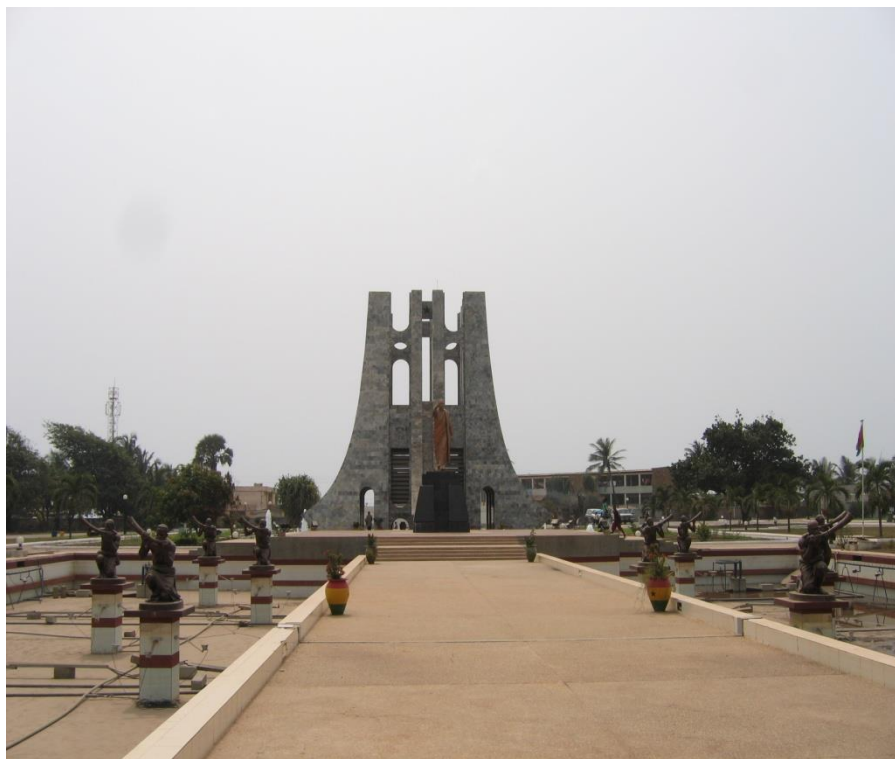
加纳标志性地标古迹——恩克鲁玛陵园

加纳海岸线长562公里，沃尔特河贯穿南北，渔业资源丰富。加纳森林覆盖面积约495万公顷，占国土面积的22%。