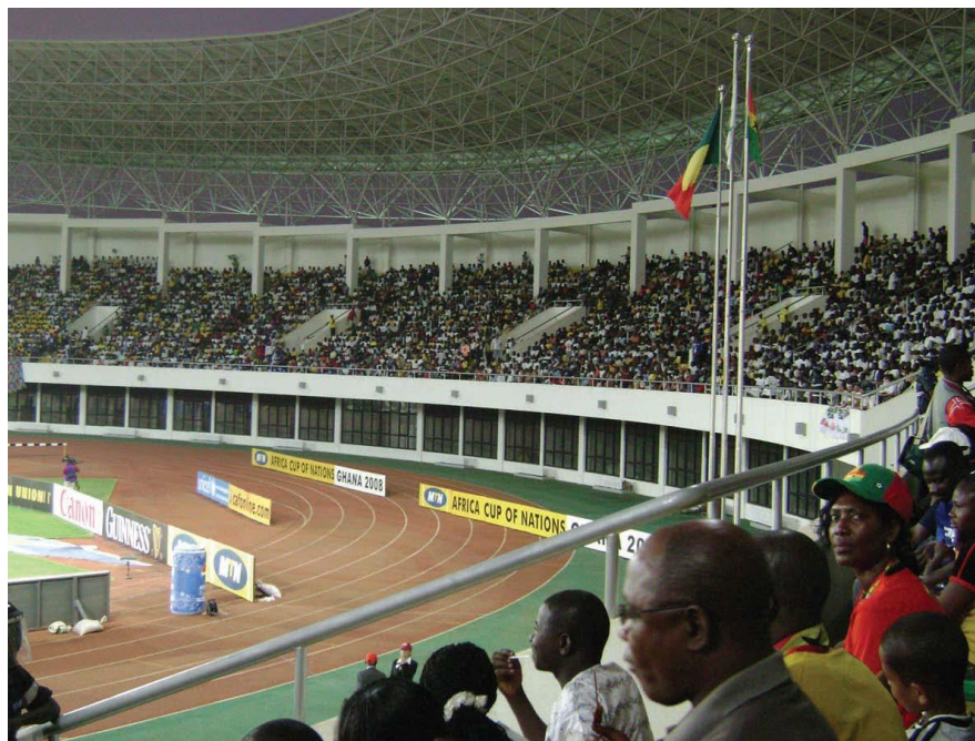
上海建工承建的使用作2008年非洲杯比赛场地的体育场

【合作协议】2016年9月，中加两国签署产能合作协议。目前尚未签署货币互换协议和基础设施合作协议。