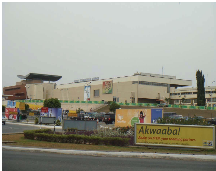
加纳科托卡国际机场

中国与加纳之间有多条航线往来，阿联酋航空公司有从北京、上海、广州、银川、香港经停迪拜直达阿克拉的航班，埃塞俄比亚航空公司也有从北京、上海、广州、成都出发经停亚的斯亚贝巴到阿克拉的航线，也可从荷兰、英国、埃及、土耳其、肯尼亚、南非等国中转往返北京和阿克拉。