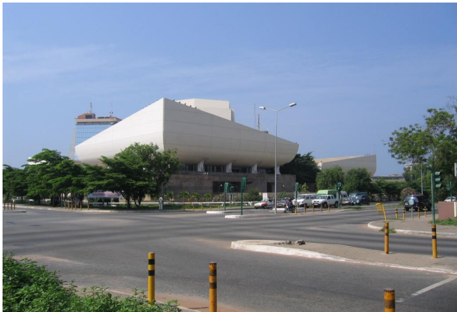
加纳首都标志性建筑——中国援加纳国家剧院外景

建交以来中国累计向加纳援助物资34笔，主要有援加纳17辆大客车、抗疟药、援外交部家具及办公用品、农业加工机械、应对气候变化物资等。在西非地区遭遇史上最严重的埃博拉疫情时，中国向包括加纳在内的多个国家无偿提供抗埃博拉物资，其中向加纳援助了价值500万元人民币的设备物资，得到了加方的高度评价和诚挚感谢。中国还向加纳派出过青年志愿者，从2009年起派出了七支援加医疗队，为加纳免费实施209例“光明行”白内障手术、42例“爱心行”心血管病手术，受到加方民众热烈欢迎。在人力资源援外培训方面，2008年以来，中国为加纳培训人员超6000人，近年来每年都要帮助超过900名加纳官员和技术人员免费赴华培训，同时，自2012年起还为加纳提供了多个“量体裁衣”的双边专题培训班，并邀请超过200名加纳留学生赴华参加援外学历教育项目。