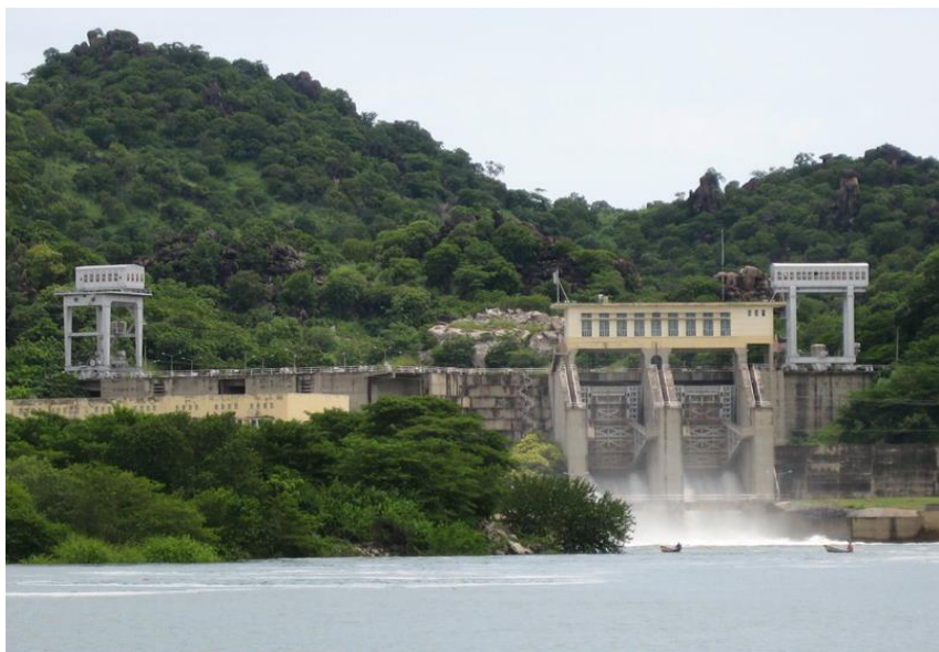
中国援建的拉格都水电站

【在建水电站】主要有曼维莱水电站，设计装机容量211兆瓦，2017年上半年竣工；默坎水电站，装机15兆瓦，已于2015年底实现试发电；比尼瓦拉克水电站，装机容量75兆瓦，2017年开工建设。隆潘卡尔水电站，装机容量30兆瓦，正在进行施工准备。