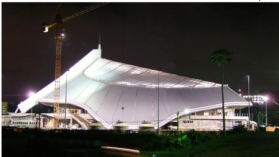
中国援建的雅温得多功能体育馆

油气领域,石油储量约1亿吨,天然气约5000亿立方米。近年来原油年产量3,400万桶左右,2017年2,890万桶,主要为重油,绝大部分用于出口,国内炼油厂主要炼轻质油,所需轻质原油主要从国外进口。喀麦隆具有开采前景的沉积盆地约3.5万平方公里,其中18,771平方公里已被批准从事勘探开发活动(包括特许石油开采区1,917平方公里和许可勘探区16,854平方公里),已探明石油储量约8亿桶(2015年数据)。目前,特许石油开采区主要集中在西南大区的里奥-德尔雷(Rio Del Rey)、以及滨海大区和南部大区的杜阿拉/克里比-坎波盆地(Douala/Kribi- Campo)。