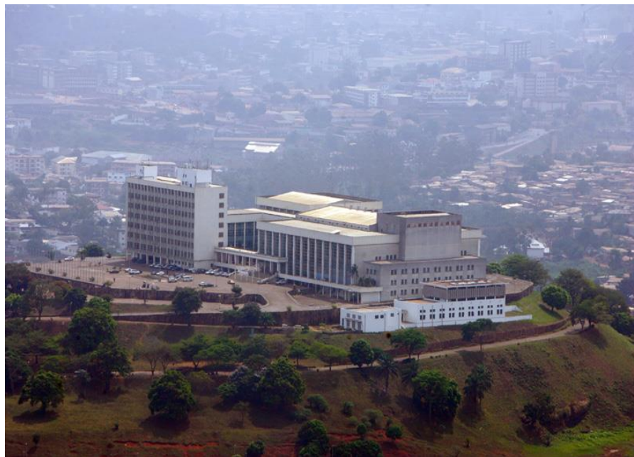
中国援建的雅温得会议大厦

喀麦隆政府主要经济部门包括经济、计划和领土整治部，财政部，农业和乡村发展部，矿业、工业和技术发展部，商务部等，其中，经济、计划和领土整治部负责国家总体经济计划的统筹安排和多双边经济合作；财政部负责政府预算的编制、管理、划拨和具体使用，国家内外债管理，税收管理，以及为各类政府贷款提供担保等；农业和乡村发展部负责制订农业政策、发展规划以及落实；矿业、工业和技术发展部负责推动工矿业和科技发展；商务部主要职能包括商业流通领域的宏观管理、平抑物价和改善商业投资环境等。