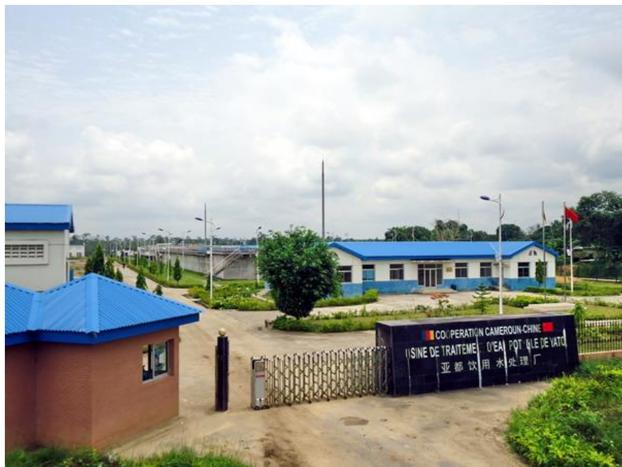
中地海外建设集团有限公司承建的杜阿拉亚都饮用水处理厂

【承包工程】据中国商务部统计，2017年中国企业在喀麦隆新签承包工程合同307份，新签合同额11.52亿美元，完成营业额18.92亿美元；累计派出各类劳务人员1246人，年末在喀麦隆劳务人员2677人。新签大型工程承包项目包括中交第一公路工程局有限公司承建雅温得机场环线项目；中国水电建设集团国际工程有限公司承建喀麦隆东部和南部地区民多姆-磊磊-恩塔姆-姆巴拉姆公路整治工程项目；中地海外集团有限公司承建Babadjou至Bamenda道路整治项目等。