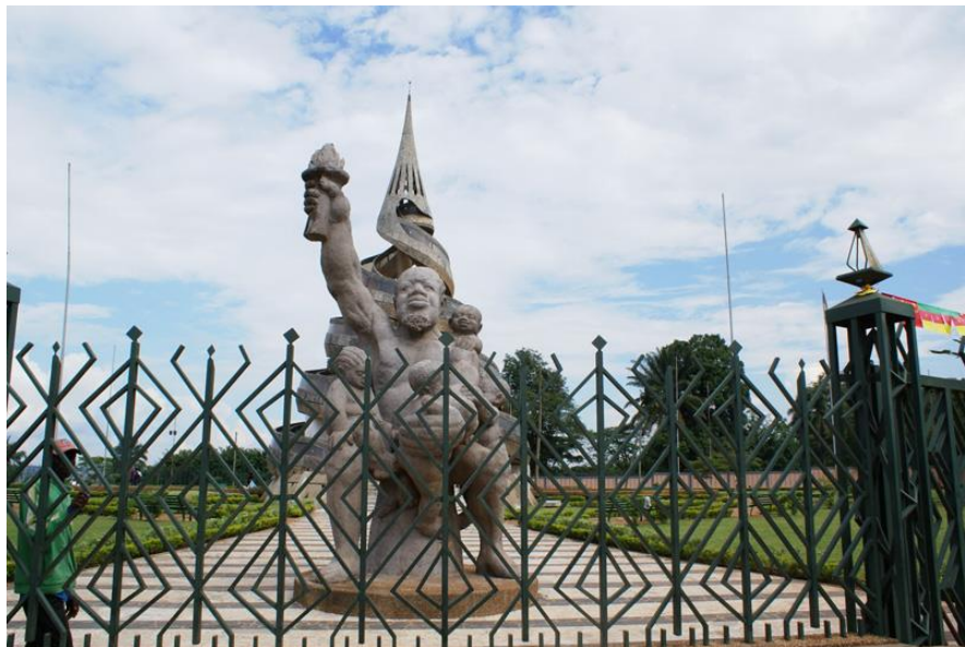
喀麦隆统一纪念塔

历史上，喀麦隆曾遭受德国殖民者的侵略，1884年沦为德国的“保护国”。第一次世界大战后，喀麦隆成为英国和法国的委任统治地。第二次世界大战后，喀麦隆成为英法两国的托管地。1960年1月1日，法国托管区根据联合国决议独立，成立“喀麦隆共和国”。1961年2月，英国托管区北部和南部分别举行公民投票，6月1日北部并入尼日利亚，10月1日南部与喀麦隆共和国合并，组成“喀麦隆联邦共和国”。1972年5月20日，喀麦隆公民投票通过新宪法，取消联邦制，成立中央集权的“喀麦隆联合共和国”，1984年1月改国名为“喀麦隆共和国”。