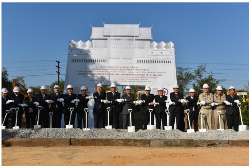
中泰高铁正式开工