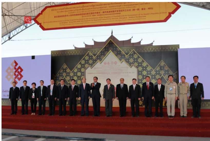
中泰高铁开工仪式