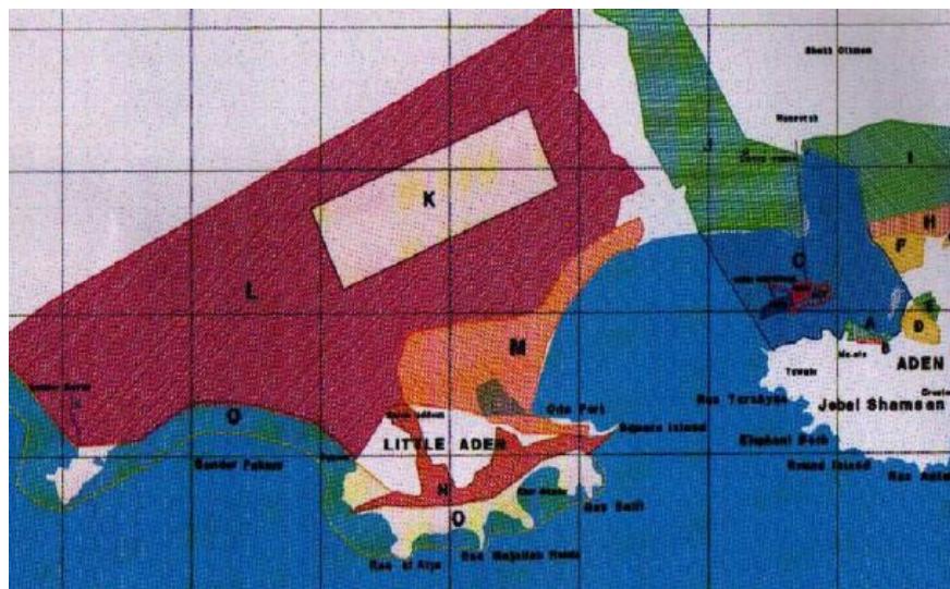
亚丁自由区功能分区图