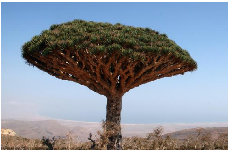
索科特拉岛特有树种——龙血树

也门有悠久的古代文明、丰富的文化遗产和杰出的建筑作品。据联合国教科文组织统计，也门有索科特拉岛等四处古迹或景区被列为世界文化遗产。“四五”规划将旅游业对GDP的贡献率从3.5%上调到4.75%，目标是吸引更多海湾国家的游客。政府将投入540万美元用于解决安全方面的问题。