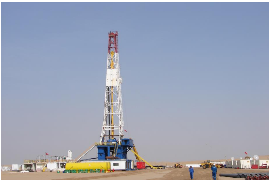
中石化国勘也门分公司投资的ABYE-1号钻探井

中、也两国政府签有文化、教育、体育、渔业和医疗卫生等方面的合作协议及领事条约。此外,上海市同亚丁省、安徽省同哈德拉毛省分别于1995年和1998年建立友好省市关系。