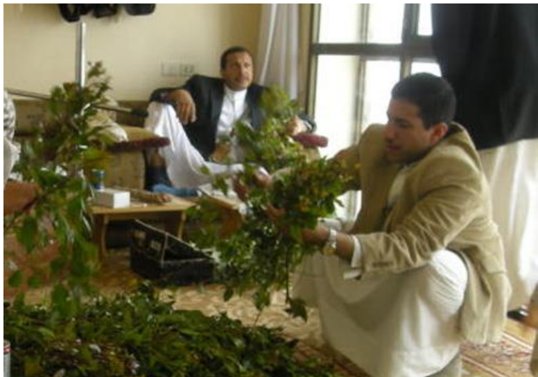
也门人日常生活中的“卡特”聚会