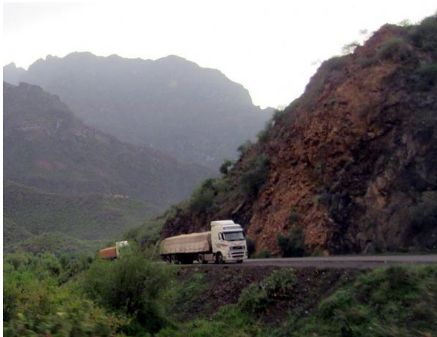
中国援建的荷台达-萨那公路

日恢复和平稳定，共同推进“一带一路”建设，实现合作共赢。2016年3月，田琦大使在利雅得会见也门副总理兼外长艾勒马赫拉斐，表示中方希望也门早日恢复和平与稳定，与也方共同推进“一带一路”建设，共同为深化中阿全面合作、共同发展战略合作关系做贡献。2016年4月，中国中东问题特使宫小生表示，中方政府支持通过政治谈判解决也门问题，支持联合国秘书长也门问题特使的斡旋努力，对也门各方拟于近期举行新一轮和谈表示欢迎。2016年5月，外交部长王毅在多哈出席中阿合作论坛第七届部长级会议前会见也门副总理兼外长马赫拉斐。2016年11月11日，中国中东问题特使宫小生会见来华访问的联合国秘书长也门问题特使艾哈迈德，就也门问题深入交换了看法。2017年9月7日，驻也门大使田琦在利雅得会见也门总统哈迪，强调中方支持政治解决也门问题，支持联合国及联合国秘书长也门问题特使的斡旋努力，希望也门尽快恢复和平，中方愿积极参与也门未来战后经济重建，与也方携手推进“一带一路”建设，造福两国人民。2018年7月11日，国务委员兼外交部长王毅在北京同来华出席中国-阿拉伯国家合作论坛第八届部长级会议的也门外交部长耶曼尼举行会谈。