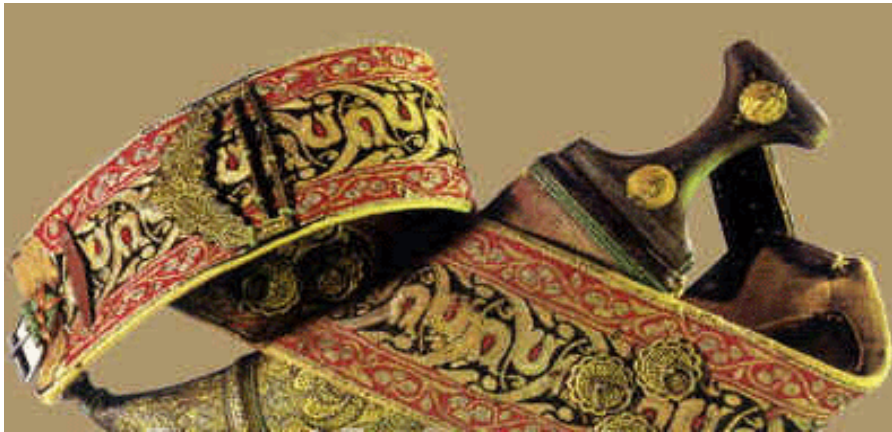
精美的也门传统服饰和腰刀

也门妇女在家可以穿着很艳丽的服装，但是外出时身披黑色长袍，带黑色头巾，大多带黑色面纱，身上戴有手镯、项链、耳环等首饰，有的还在手、脚和脸上画着姜黄色的各种图案，作为装饰。随着现代意识的不断引入，也有一部分受高等教育并工作的也门妇女只包头，不再戴面纱。