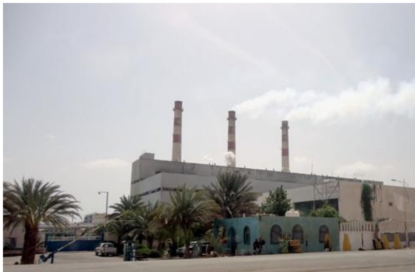
亚丁自由区发电厂