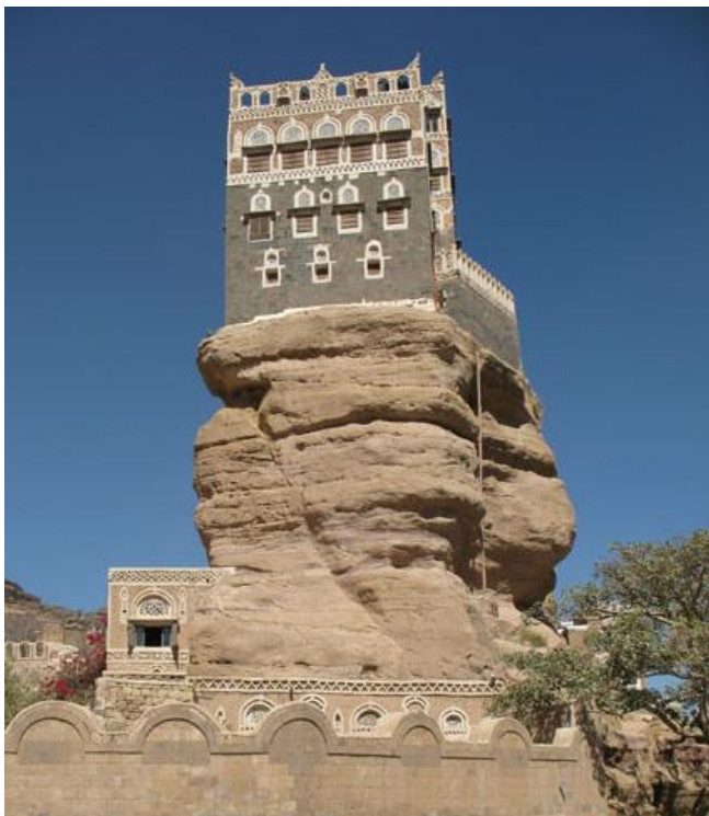
叶海亚王宫（又称石头宫）

【塔兹】塔兹省首府，最重要的商业城市之一，位于也门中部，曾是伊玛姆王朝时期的陪都。塔兹省人口296.9万（2012年）。