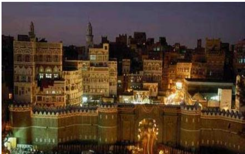
萨那老城（又称也门门）

也门水资源紧缺，主要依靠地下水。近年来，一些地方由于过度开采地下水，水资源紧张的趋势进一步加剧。