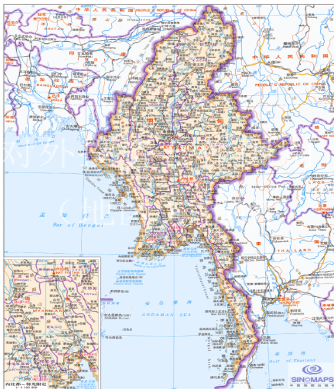
图 1 缅甸地图

缅甸全国分为 7 个省、7 个邦和 2 个中央直辖市。缅甸属于热带季风气候，国土的大部分在北回归线以南，为热带，小部分在北回归线以北，处于亚热带。缅甸生态环境良好，自然灾害较少。