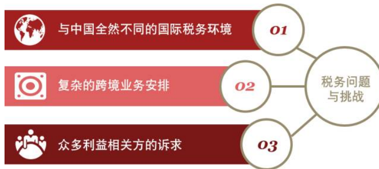
图4 海外工程项目税务特点示意图

海外工程项目也是“走出去”的常见形态之一。海外工程项目有别于国内工程项目存在如下三个主要的税务特征：