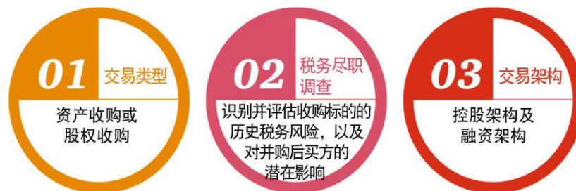
图3 海外并购税务要点示意图

按照常见的海外并购流程，并购前中国企业应该主要关注如下三项税务工作要点，并做好准备：