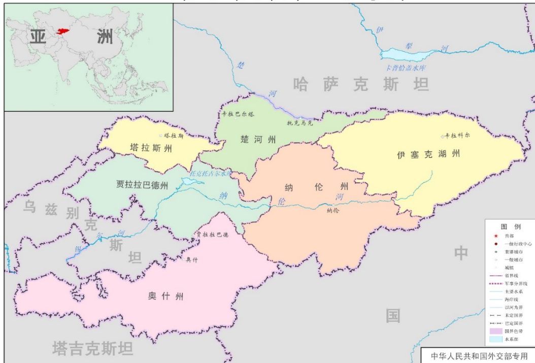
吉尔吉斯斯坦示意图

吉尔吉斯斯坦全国划分为 7 州 2 市，州、市下设区，区行政公署为基层政府机构。7 个州分别为：楚河州、塔拉斯州、奥什州、贾拉拉巴德州、纳伦州、伊塞克湖州、巴特肯州。2 个市分别为：比什凯克市和奥什市(Osh, Ош)。其中，比什凯克市是吉尔吉斯斯坦的首都，全国政治、经济、文化、科学中心，主要的交通枢纽。面积 130 平方公里，人口约 102.26 万（2018 年 11 月）。奥什市是吉尔吉斯斯坦第二大城市，人口约 29.31 万（2018 年 11 月） [2] ，位于南部的费尔干纳盆地中，被称作“吉尔吉斯斯坦的南方之都”。