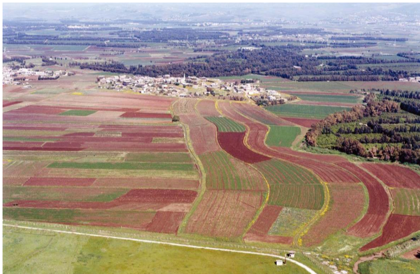
“黎巴嫩粮仓” 贝卡谷地