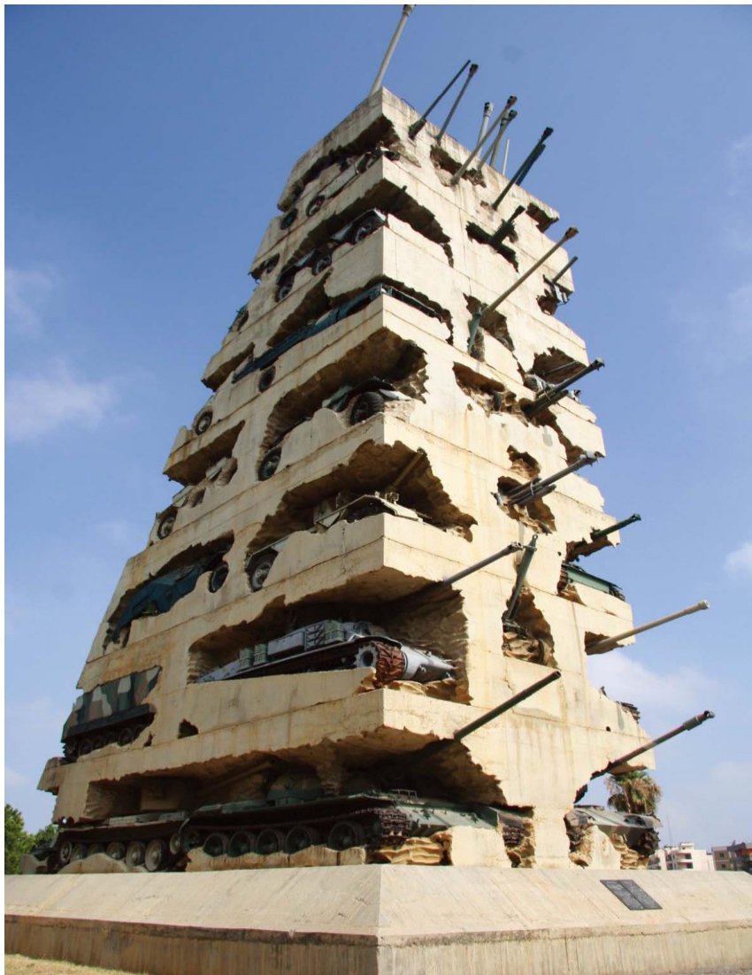
黎巴嫩内战纪念碑