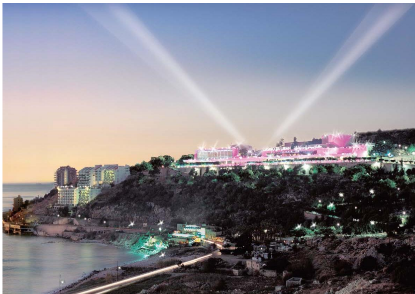
贝鲁特北侧休闲城市朱尼湾的夜晚

【政府】总理是政府首脑，主要职权是：领导内阁，并担任最高国防委员会副主席；在与议会协商后，组成政府；与总统共同签署除任命总理、接受内阁集体辞职或要求内阁解散以外的命令；签署要求召开特别会议和颁布法律及要求重新审议法律的命令；要求内阁召开会议并事先向总统通报会议内容和将要讨论的紧急议题；监控国家机构的管理工作，协调各部委间关系。2018年5月22日，总统府发表声明称，根据黎巴嫩宪法有关条款，现政府转为看守政府，直至新政府组成。2019年1月31日，经协调各方利益后完成组阁，萨阿德·哈里里（Saad Hariri）为总理。