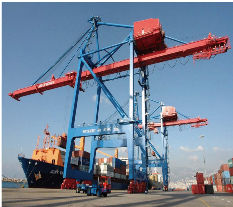
贝鲁特港口新标志——上海振华港机

的黎波里港新泊位于2016年1月正式启用，新码头岸线长600米，港池水深15.5米。新泊位的运行将为2000多人提供新的就业机会。2013年，的黎波里港口同阿联酋酋GULFTAINER公司签约，由该公司以BOT方式进行黎波里港口新建集装箱码头的后续建设和运营，特许经营权为25年。