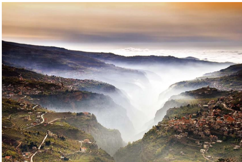
世界遗产—加迪沙峡谷