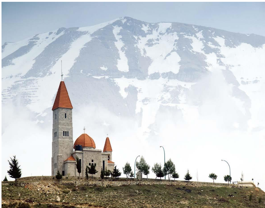
大雪山旁巴沙尔镇的教堂