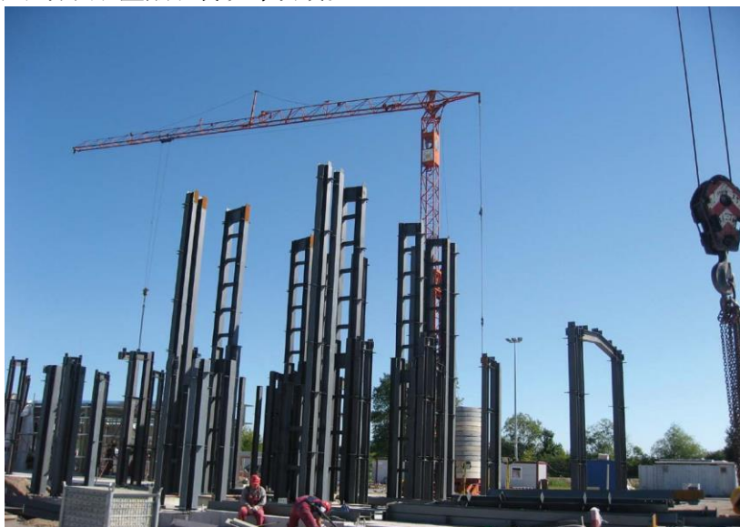
清华同方威视公司中标的500万美元立陶宛集装箱检测设备项目安装现场

【投资】目前中国在立陶宛的直接投资规模较小。据中国商务部统计，2018年当年中国对立陶宛直接投资流量-447万美元。截至2018年末，中国对立陶宛直接投资存量1289万美元。投资主要分布在通讯、电网设计、电子、纺织、金融、餐饮等领域。