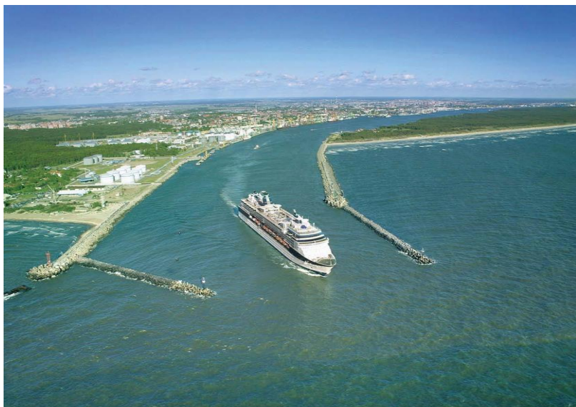
立陶宛克莱佩达港口

进出克莱佩达港的货物可通过铁路和公路运输, 目前70%以上货物通过铁路运输, 包括石油产品、化肥、金属制品、粮食、原糖等。有两个火车站为港口服务, 从港口到白俄边境站433公里、至明斯克595公里、至莫斯科1303公里。目前, 从克莱佩达港到乌克兰黑海港口及莫斯科有两趟货运列车: 克莱佩达-基辅-奥得萨/伊利契夫斯克港口的VIKING号、克莱佩达/加里宁格勒港口-明斯克-莫斯科的MERKURIJUS号。从克莱佩达港至奥得萨的货运列车使中亚国家与北欧国家之间的货物运输便利化。最近几年, 通过公路运输的货物也在增加, 包括集装箱、滚装货物、食品等。通过公路从港口至维尔纽斯315公里, 至明斯克482公里, 至莫斯科1150公里。