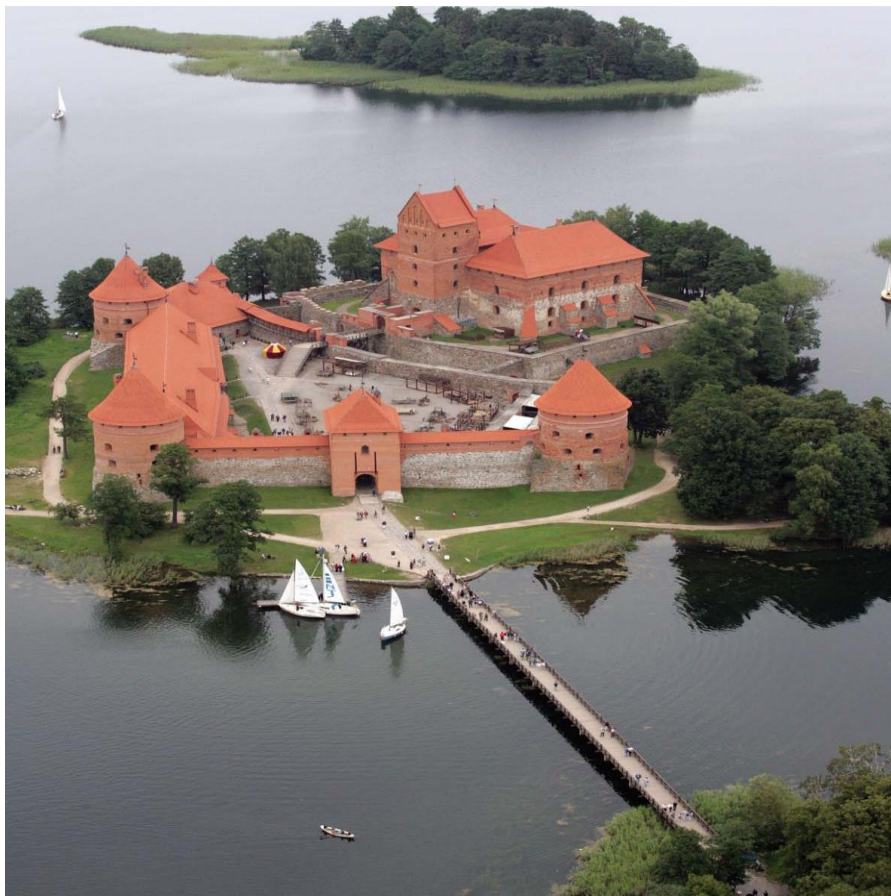
立陶宛著名景点特拉盖