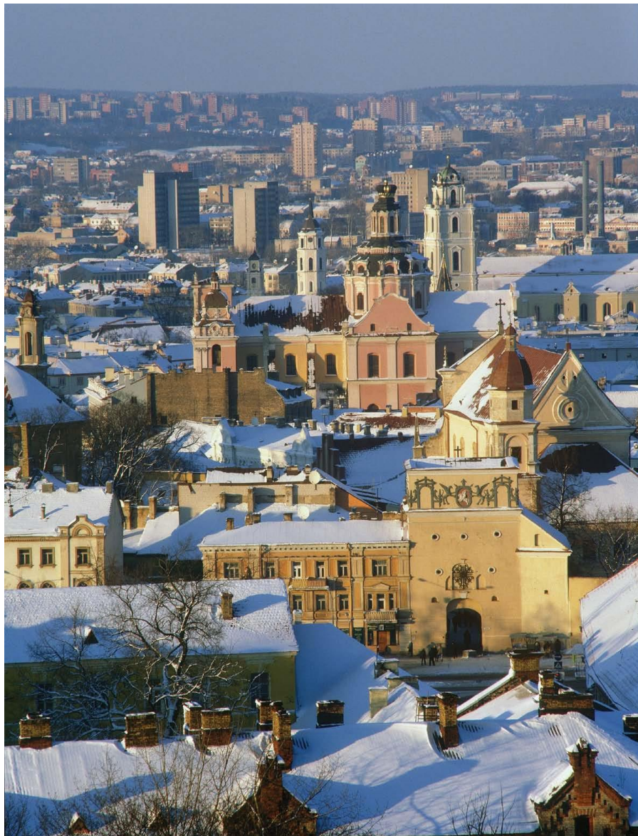
立陶宛首都维尔纽斯老城冬季

【首都】维尔纽斯是立陶宛的首都和最大城市，面积400平方公里，2019年人口81万。维尔纽斯的工业产值占立陶宛全国工业总产值的三分之