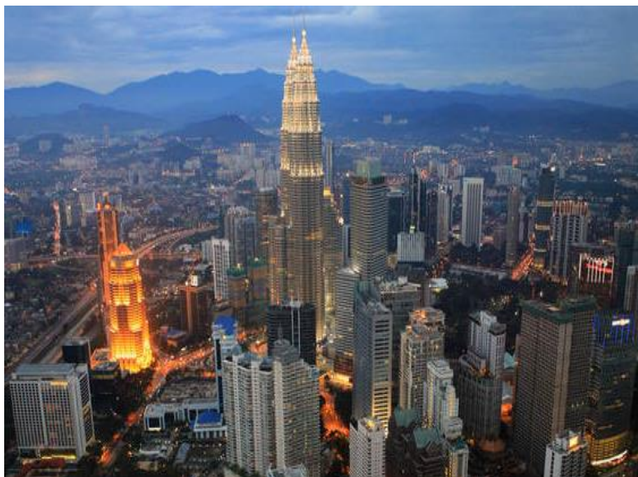
从吉隆坡塔俯瞰全城

马来西亚高速公路网络比较发达，主要城市中心、港口和重要工业区都有高速公路连接沟通。高速公路分政府建设和民营开发两部分，但设计、建造、管理统一由国家大道局负责。截至2017年，马来西亚公路总长约为23.7万公里。相较于西马，沙巴与砂拉越的公路系统发达程度较低，品质也较差。目前，马来西亚高速公路网络由贯穿南北的大道为中心构成。