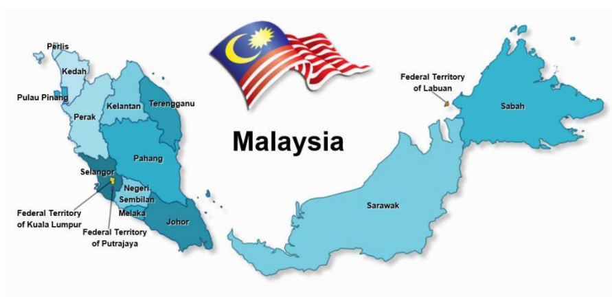
马来西亚行政区划

马来西亚分为13个州和3个联邦直辖区。13个州包括西马的柔佛、吉打、吉兰丹、马六甲、森美兰、彭亨、檳城、霹靂、玻璃市、雪兰莪、登嘉楼和东马的沙捞越、沙巴。3个联邦直辖区为首都吉隆坡(Kuala Lumpur)、联邦政府行政中心——布特拉加亚(Putrajaya)和东马的纳闽(Labuan)。马来西亚其他主要的经济中心城市包括：乔治市(檳城州首府)、新山(柔佛州首府)、关丹(彭亨州首府)和古晋(沙捞越州首府)。由于历史原因，东马的沙捞越和沙巴两州在政治和经济上拥有较大自主权。