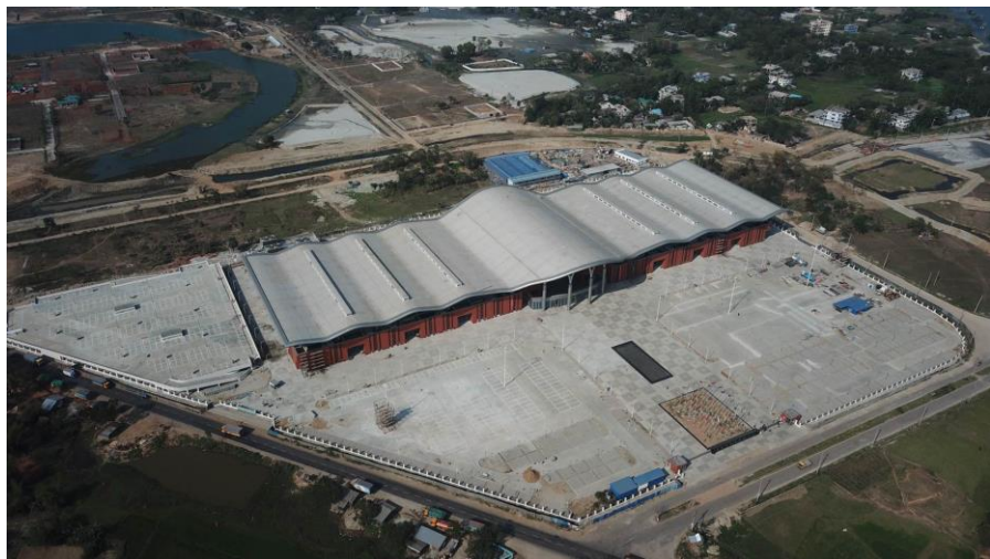
接近竣工的孟中友谊展览中心项目

从援款支出情况看，2018/19财年，孟加拉国实际使用援款最多的部门为交通部门，使用援款10.98亿美元，占本财年实际使用援款总额的16.8%；其次为科技部门，使用援款10.73亿美元，占比16.5%；再次为电力部门，使用10.1亿美元，占比15.5%。此外，教育宗教、公共管理、建设规划、科研、社会福利等部门也使用援款较多。