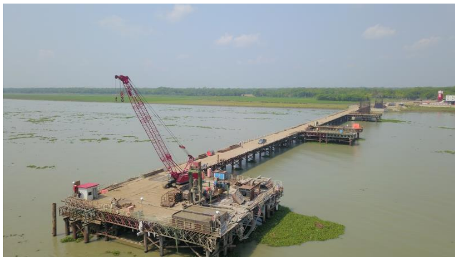
正在建设中的孟中友谊八桥

【接受国际社会新冠肺炎疫情专项援助情况】中国最早向孟加拉国提供孟加拉国最急需的检测试剂等医疗物资援助。2020年2月，当中国还处在抗疫最艰难时期，检测试剂非常紧缺宝贵的情况下，中国驻孟加拉国使馆就向孟加拉国捐赠了500个检测试剂。3月26日和29日，又分别捐赠了40000个检测试剂、315000个医用N95口罩及医用普通口罩、10000套防护服和1000个体温枪。4月8日，视频连线国内著名抗疫专家张文宏教授向孟加拉国卫生部门人员交流抗疫经验。目前，正在准备国内医疗专家组赴孟加拉国实地帮助抗疫工作。此外，大批中国企业和其他组织也自发向孟加拉国社会各界捐赠了大量检测试剂、口罩等，在孟加拉国中资企业协会和华人华侨还发起帮助孟加拉国当地贫困人群的募捐及分发食物行动。