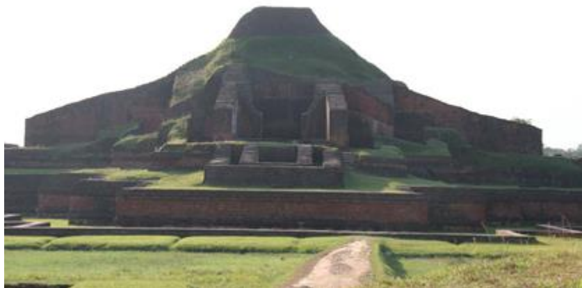
帕哈尔普尔佛教寺院遗迹