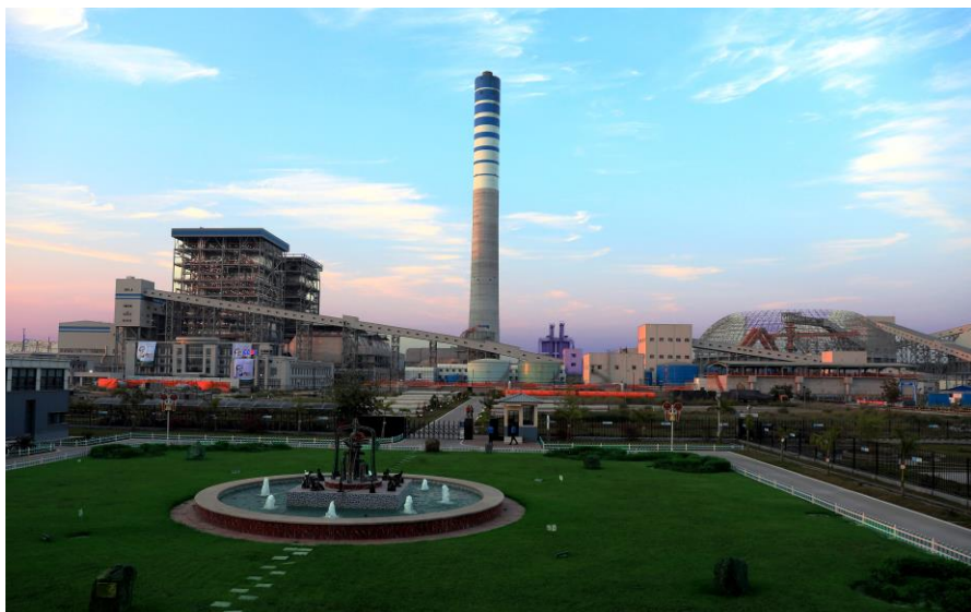
帕亚拉1320MW燃煤电站项目

中资企业积极利用PPP模式（含BOT、BOOT、PFI、BOO、BLT、DBFO等多种模式），参与孟加拉国基础设施建设。其中，帕亚拉燃煤电站项目由中机公司和孟加拉国国有的西北电力公司联合投资建设，项目模式为BOO，项目正在建设中；博杜阿卡利1320MW燃煤电站项目是北方国际合作股份公司与孟加拉国乡村电力公司联合投资的电力PPP项目，双方各占股50%，项目已于2019年8月开工；中国经济工业园项目由中国港湾与孟加拉国经济区管理局联合投建，项目合作模式为PPP，处于开工前准备阶段；2018年12月，四川路桥联营体中标的达卡绕城公路项目正式签约，该项目是孟加拉国首个公路类PPP项目，已于2019年12月开工。