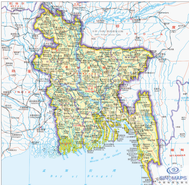
地图来源：中国地图出版社