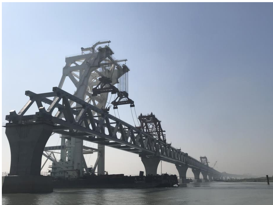
在建的梦想之桥—帕德玛大桥

据中国商务部统计，2019年，中资企业在孟加拉国新签合同284份，新签承包工程合同额134.84亿美元，完成营业额53.03亿美元；累计派出各类劳务人员7853人，年末在孟加拉国劳务人员15835万人。新签大型工程承包项目包括中国水电建设集团国际工程有限公司承建孟加拉国普尔巴里2X1000MW超超临界燃煤电站二期项目；北方国际合作股份有限公司承建孟加拉国博杜阿卡利1320（2*660MW）燃煤电站项目等。