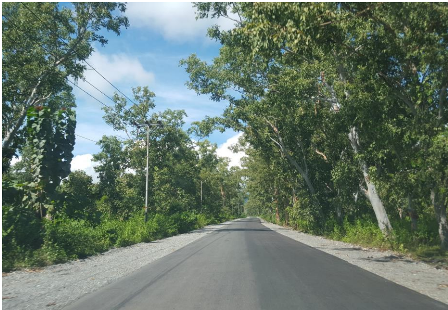
马纳图托-拉克鲁巴道路改造及维护项目

签大型承包工程项目包括中国土木工程集团有限公司承建东帝汶比亚佐液化天然气厂港口设施项目；中国武夷实业股份有限公司承建东帝汶劳拉雷至索利雷马项目等。主要工程承包项目包括上海建工集团股份有限公司承包东帝汶警察局大楼；中铁国际集团有限公司承包东帝汶包考-维可公路项目；上海建工集团股份有限公司承包东帝汶小型道路项目等。东帝汶工程项目大都采用欧美标准。项目设计方案并非由中国企业制作，因此中国标准较难被采用，也没有来自中国的项目监理。