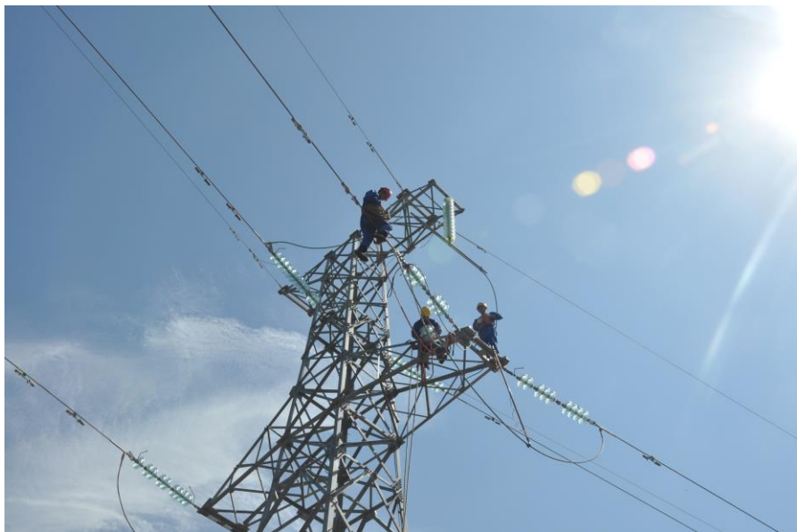
中核二二公司承建的东帝汶国家电网项目