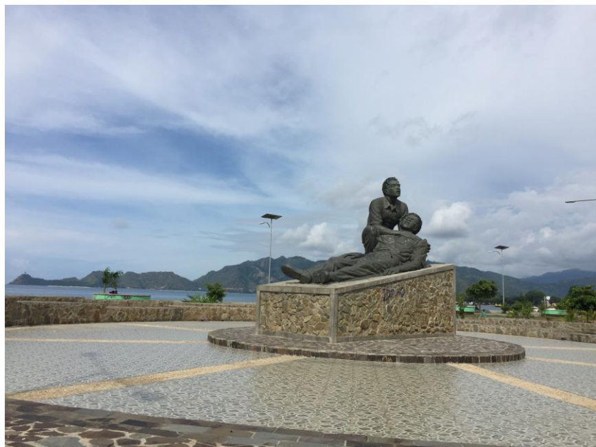
国家青年纪念雕像