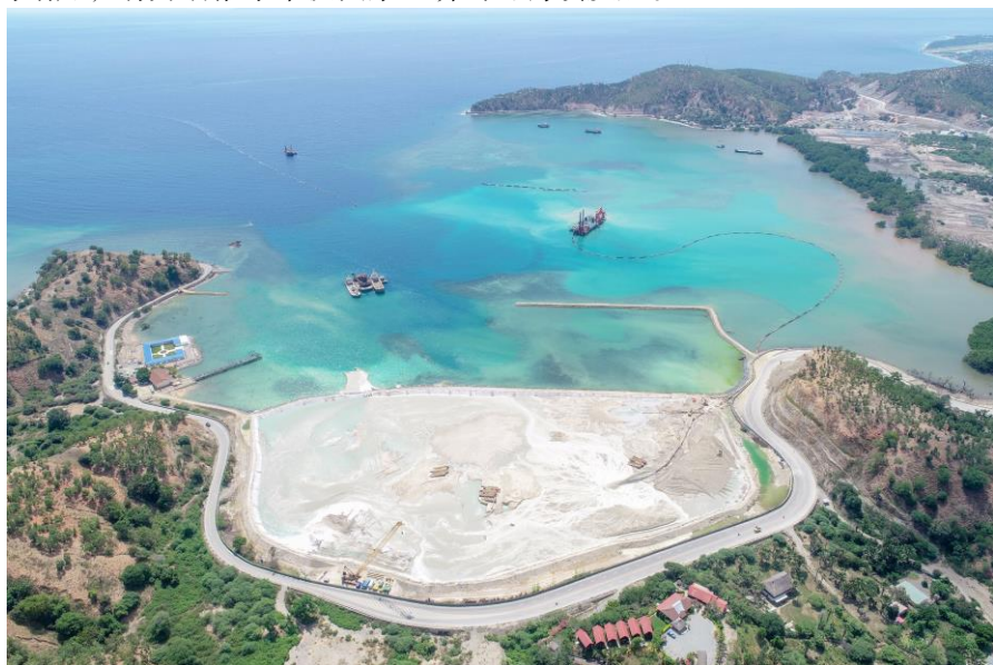
中国港湾公司承建的东帝汶蒂坝港项目

2018年8月30日，蒂坝港正式开工建设，中交集团下属子公司中国港湾工程有限公司承建，该港口规划有630m码头岸线，码头前沿水深设计达-14m，可靠泊10万吨级货船，后方堆场达27公顷，以吹填造地的方式形成，将使港口吞吐能力大为增加。蒂坝港设计能力为60万TEU/年，并预留空间，可将吞吐能力扩建至100万TEU/年。港口预计将于2021年建成，届时帝力港的货运功能将整体迁移，受益于港口吞吐能力、作业效率的大幅增加，海运成本将大幅下降约40%，与地区及全球的互通互通能力将大为增加，有力助推东帝汶国家经济的可持续发展。