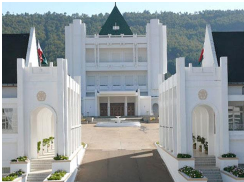
雅武麓总统府