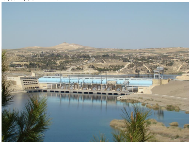
迪什林水电站发电机组

叙利亚2012年电力总发电量约为29480吉瓦时，总用电量约为25700吉瓦时，总装机容量为8958兆瓦，进口电量1234吉瓦时，未出口电量。世界银行数据显示，2014年叙利亚人均电力消费950千瓦时。世界银行数据显示，2014年叙利亚人均电力消费950千瓦时。世界银行数据显示，截至2017年叙利亚平均用电普及率为89.64%，城市用电普及率为100%，农村地区的普及率为77.7%。