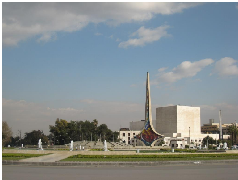
伍麦叶广场-叙利亚首都标志性建筑

【政府】叙利亚现政府成立于2000年3月13日, 2001年12月13日、2003年9月18日、2004年10月4日、2006年2月11日、2007年12月8日和2011年4月14日第六次改组, 现有31名成员。总统是国家元首, 由人民议会选举产生, 每届任期为7年, 内阁是国家最高行政管理机构, 由内阁会议主席和各部部长组成, 内阁成员由总统任命并向总统负责。2014年8月, 叙利亚总统再次任命哈勒吉(Wael Al-Halaki)担任总理。本届政府于2016年7月3日成立, 2017年3月和2018年1月两次改组, 有32名阁员, 包括总理伊马德·哈米斯(Imad Khamis), 副总理兼外交与侨民部长瓦立德·穆阿利姆(Walid Al-Moualem), 国防部长阿里·艾尤布(Ali Ayoub)等。