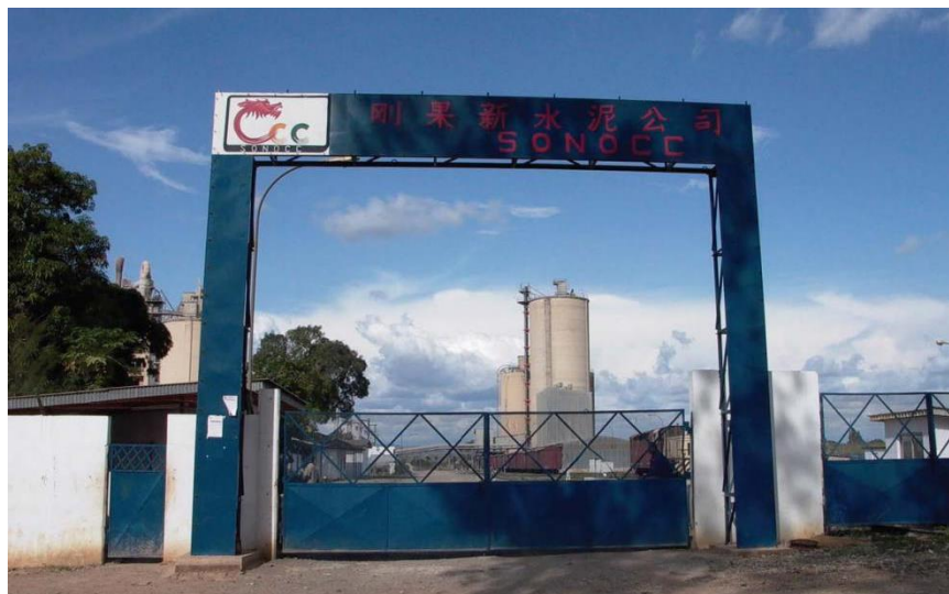
中国路桥与刚方合资建成年产30万吨刚果新水泥厂

【工业产业】近年来，刚果（布）工业增长平均达到8%，2019年工业产值约占国内生产总值的58.25%。