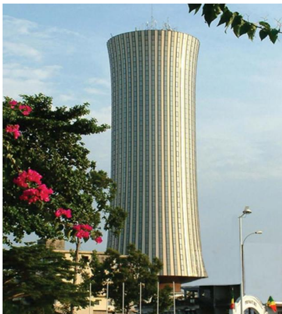
政府办公楼（当地俗称“腰鼓楼”）

2016年4月，萨苏宣誓就职总统，开启新一轮5年任期。同月，萨苏总统任命克莱芒·穆昂巴为总理，并由其组建新内阁。2017年8月，在立法和地方选举之后，内阁进行改组，新设副总理一职，内阁成员由上一届的39人减至36人，基本保留了原班人马。2019年9月和2020年3月，内阁决定撤消妇女促进和参与发展部和运输、民用航空和商船部，与其他有关部门组建新机构。目前主要政府部门有：农业、畜牧业和渔业部；经济、工业和国有资产部；贸易、供应和消费部；内政和地方分权部；矿业和地质部；领土整治、装备和大型工程部；石油天然气部；外交、合作和海外侨民部；国防部；财政和预算部；新闻和媒体部；高等教育部；装备和道路养护部；初中等教育和扫盲部；司法、人权和土著民族促进部；中小企业、手工业和非正规部门部；能源和水利部；土地事务和公产管理负责与议会关系部；经济特区部；技术职业教育、专业技能培训 and 就业部；建设、城市规划和