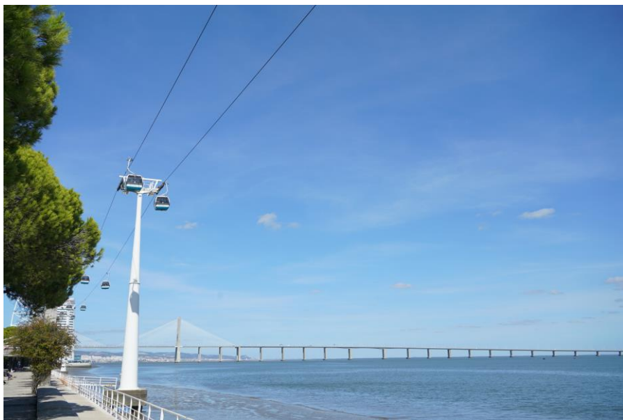
里斯本达伽马大桥

里斯本不同于世界其他主要大城市，行政上的“里斯本市”只局限在其历史城区，占地100平方公里，而其周边地方则发展成其他的城市，但属于里斯本区的一部分。2018年里斯本市人口50.7万，里斯本区人口为284.6万。里斯本区是葡萄牙最富庶的地区，人均GDP远高于全国人均GDP水平。