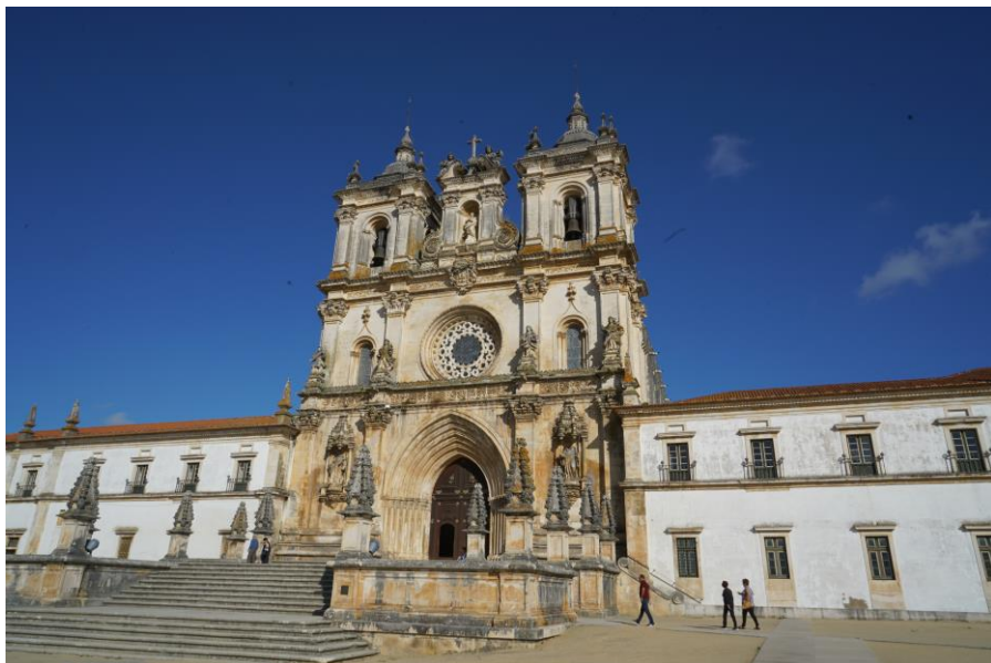
阿尔克巴萨修道院