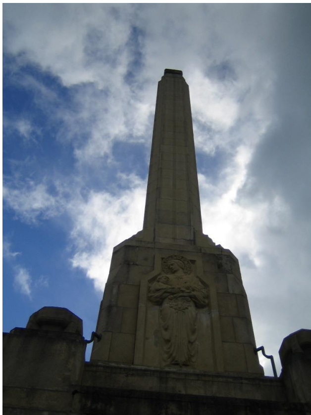
新西兰名胜 - 工党纪念碑

【工党】执政党。1916年成立。曾多次执政。2008年大选失利后下野。2017年10月19日，工党与新西兰第一党、绿党经过谈判，组成由绿党支持的工党—第一党联合政府。现任领袖杰辛达·阿德恩(Jacinda Ardern)。该党主张实行民主社会主义，重视社会福利制度，对社会政策加大政府干预。