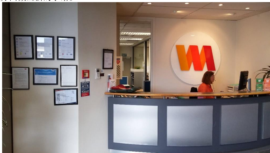
首创新西兰环境治理公司

兰进口产品的关税，其中24.3%的产品从协定生效时起即实现零关税。服务贸易方面，新西兰在商务、建筑、教育、环境等4大部门的16个分部门做出了高于WTO的承诺；中国在商务、环境、体育娱乐、运输等4大部门的15个分部门做出了高于WTO的承诺。此外，中新自贸协定还在人员流动、投资、海关、检验检疫、知识产权、透明度以及合作等方面做出了自由化、便利化安排或制度性规定。2016年11月，中新两国共同宣布正式启动中国-新西兰自贸协定升级谈判。2019年5月自贸区第七轮谈判在新西兰举行。2019年11月4日，中新两国正式宣布结束自贸升级谈判。中新自贸协定升级谈判对原有的海关程序与合作、原产地规则及技术性贸易壁垒等章节进行了进一步升级，新增了电子商务、环境与贸易、竞争政策和政府采购等章节，双方还在服务贸易和货物贸易市场准入、自然人移动和投资等方面做出新的承诺。