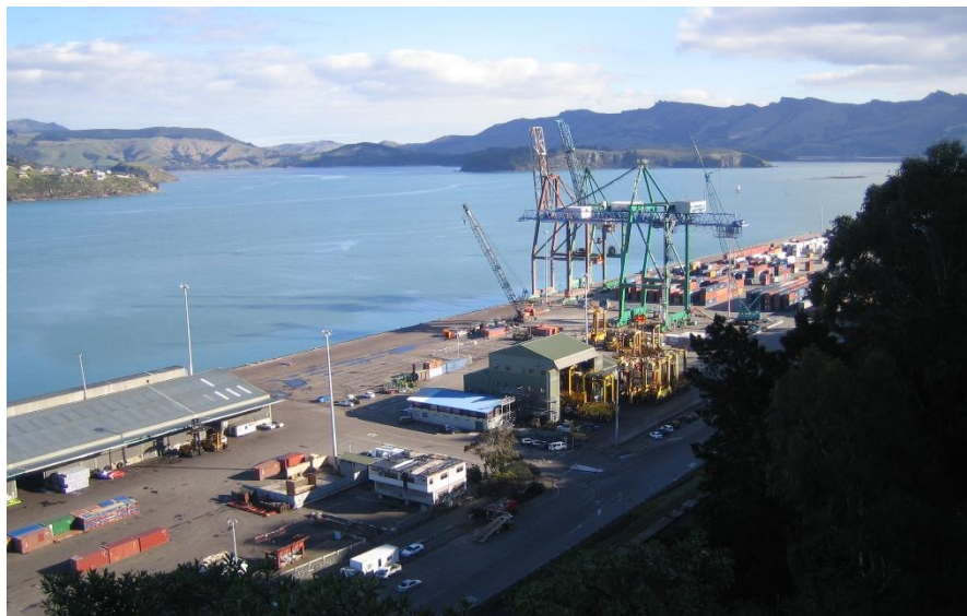
新西兰南岛最大港口 - 立特顿港

新西兰进出口货物均依靠海运运输，因此港口众多，设施发达。新西兰的主要港口共有13个，其中奥克兰港、陶朗加港和克赖斯特彻奇立特顿港是最大的三个港口，港口吞吐能力约为4800万吨。此外，新西兰北岛的惠灵顿和南岛的皮克顿之间每天有数班轮渡往来。