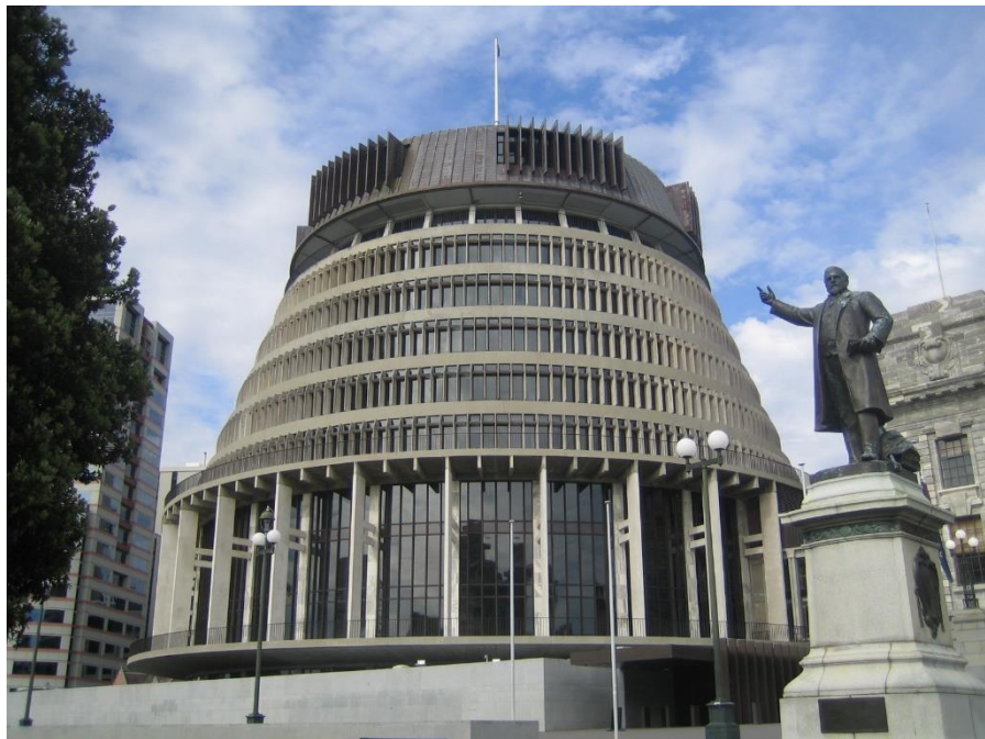
新西兰首都惠灵顿 - 国会大厦

【其他主要城市】人口最多的工商业和港口城市为奥克兰，位于北岛。其他主要城市有：克赖斯特彻奇（基督城）、汉密尔顿、但尼丁、陶朗加等。著名旅游城市有位于南岛的皇后镇，以及位于北岛的陶波、罗托鲁阿等。