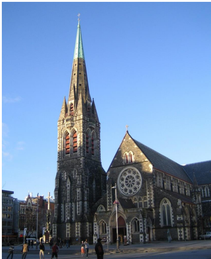
新西兰南岛商业重镇 - 克赖斯特彻奇

【主权评级】截至2020年4月3日，国际评级机构穆迪宣布对新西兰主权信用评级为Aaa，展望为负面。截至2020年4月8日，国际评级机构惠誉对新西兰主权信用评级为AA，展望为负面。截至2019年1月31日，国际评级机构标普对新西兰主权信用评级为AA+，展望为正面。