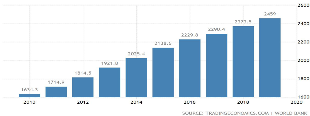
图 3 乌兹别克斯坦 2010 年至 2019 年人均 GDP 统计图（单位：美元）

呈缓慢上升趋势，近 5 年人均 GDP 为 2298.26 美元，居民生活水平逐年提高。