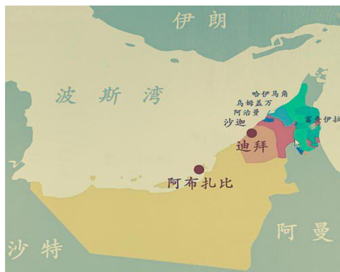
图 1 阿联酋地图

阿联酋位于阿拉伯半岛东南端, 东与阿曼毗邻, 西北与卡塔尔接壤, 南部和西南与沙特阿拉伯王国交界, 北临波斯湾(又名阿拉伯湾), 与伊朗隔海相望, 是扼波斯湾进入印度洋的海上交通要冲。国土面积约为 8.36 万平方公里 [1] (包括沿海岛屿), 首都阿布扎比。其中面积最大的是阿布扎比酋长国, 其次是迪拜酋长国。