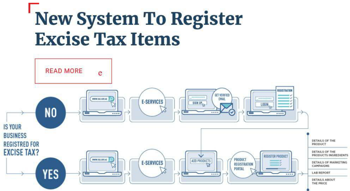
图3 新系统消费税登记指引