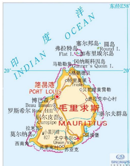
图1 毛里求斯地图 [2]

毛里求斯本岛浅海为珊瑚礁环绕；沿海为平原；中部为高原，包括大港山脉、黑河山脉和莫卡山脉，平均高度600米。最高峰黑河之巅，高826米。河流短小，东南大河最长，约34公里。属亚热带海洋性气候，终年温暖潮湿。沿海地区年平均气温 25^{\circ}\text{C} ，中央高原 20^{\circ}\text{C} 。