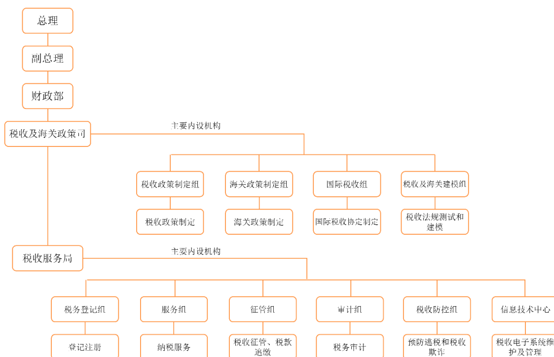
图2 格鲁吉亚税收管理机构的组织架构图

格鲁吉亚的税收管理机构为财政部，格鲁吉亚税收及海关政策司（Tax and Customs Policy Department）以及税收服务局（LEPL – Revenue Service）隶属于财政部。格鲁吉亚税收管理机构的组织架构，请见如下示意图：