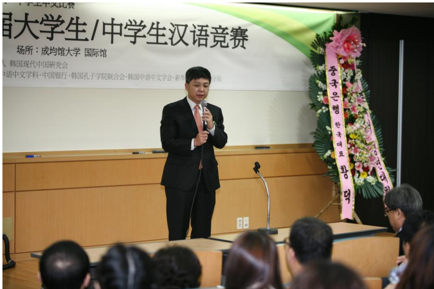
中国银行首尔分行举办汉语竞赛

【案例】中国银行首尔分行已连续18年资助“孔子学院”在韩国举行的汉语竞赛——“汉语桥”。该活动吸引了众多韩国青年人参与，中国银行首尔分行充分利用其关注中国文化的特点，现场布置了中国文化元素的产品和宣传资料，使得现场参与者通过中国文化了解中国银行，使用中国金融产品来体验中国文化，对优胜选手发出工作邀请函，实现中国文化、中行品牌共同发展。