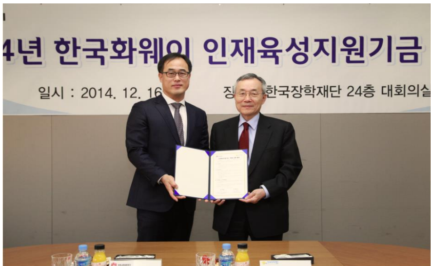
华为公司设奖学金资助当地贫困学生