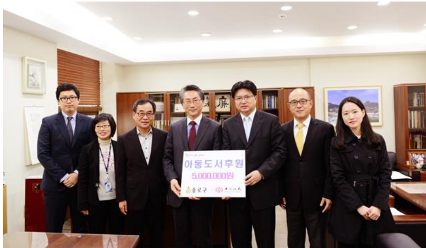
“爱心in! 希望箱子”捐赠活动

【案例一】2014年12月，中国银行首尔分行参加首尔市钟路区政府主办的“爱心in! 希望箱子”捐赠活动，向钟路区贫困家庭捐赠了价值500万韩元的生活必需品；2015-2019年，该行联合首尔钟路区政府向韩国贫困高中生每年发放1400万韩元的奖学金，帮助他们坚持梦想，实现美好未来；韩国新冠肺炎疫情爆发后，该行向大邱社会福利共同募捐会捐款1.7亿韩币，用于大邱社会福利机构的防疫救治工作，还紧急募集9万只口罩，捐赠给首尔市厅、大邱市、安山市、首尔钟路区厅和在韩中国留学生。