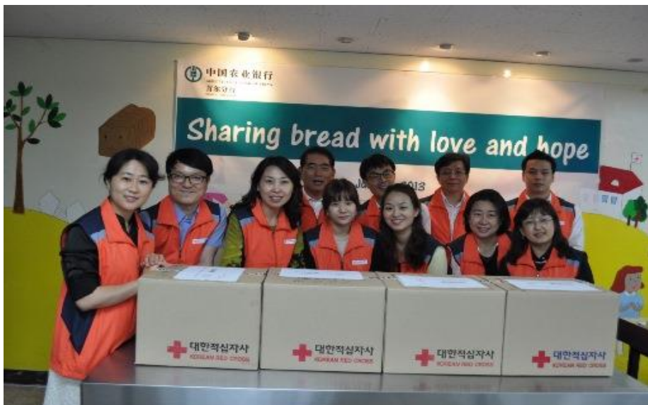
中国农业银行首尔分行员工献爱心

【案例二】中国农业银行首尔分行员工在首尔市中区韩国红十字会，为该区流浪者和孤独老人奉献爱心；韩国新冠肺炎疫情爆发后，该行向大韩红十字会捐款1亿韩币，支持韩国抗击疫情。