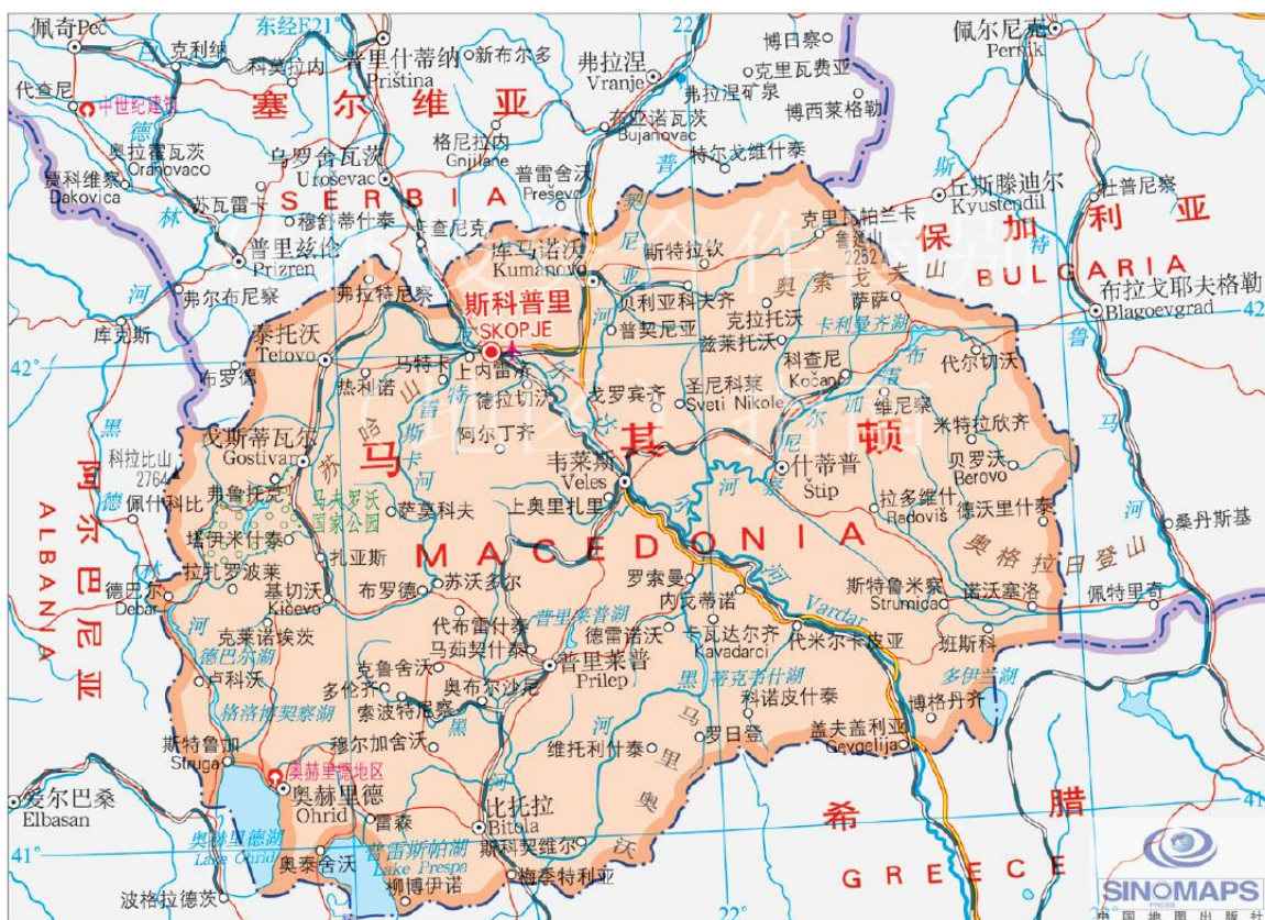
图1 北马其顿共和国地图

其顿国土面积为25,713平方公里，地形为多山，瓦尔达尔河（Vardar）纵贯南北。北马其顿是希腊经巴尔干半岛通往东、西、中欧，以及经保加利亚连接东方的一条主要货物运输通道。